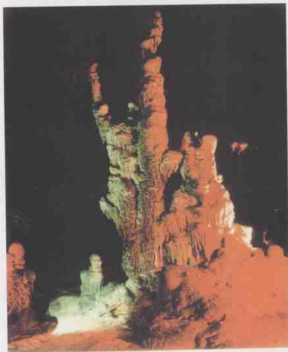
穿山镇乐迷岩内的「玉树琼枝」一景