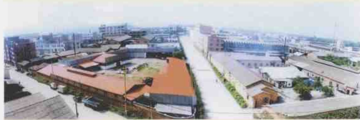
柳江县第一工业开发区全景