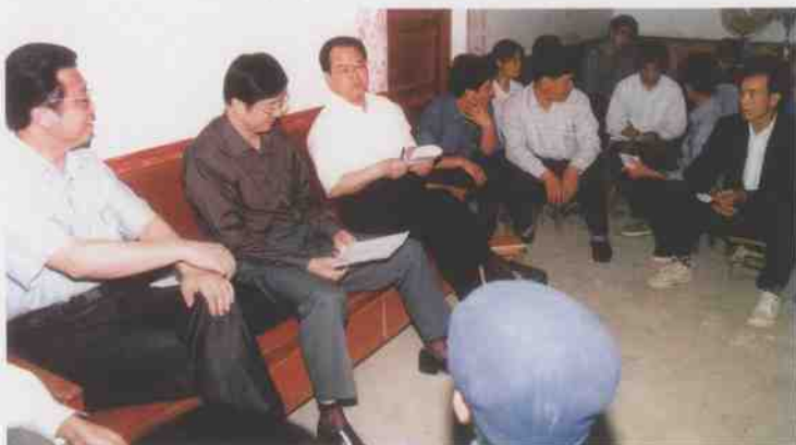
2002年4月8日，自治区党委书记曹伯纯到柳江县百朋镇怀洪村委与农民“三同”。图为曹书记（左三）在农民家里与农民亲切交谈。