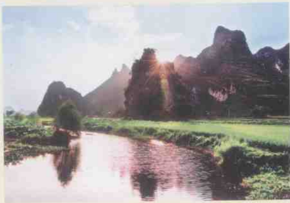
风光 旖旎的百 朋酒壶山