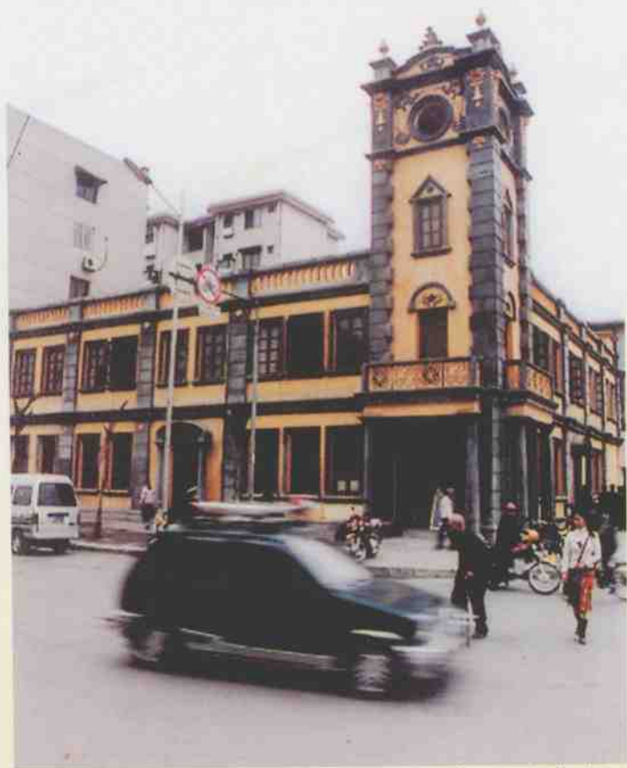
解放初期，县市分治时，柳江县县委、县政府办公所在地——柳州市乐群社。