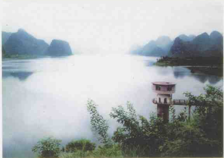
风景宜人的龙怀风景区