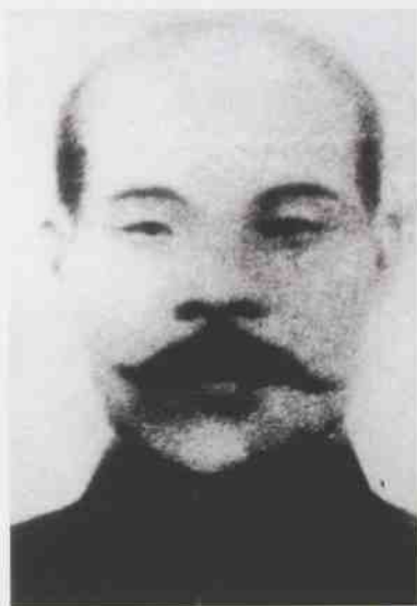
柳江“辛亥骁将”刘古香

►熊秀民，第一个加入中国共产党的柳江人，1927年被国民党反动派迫害英勇就义，当时年仅30岁。