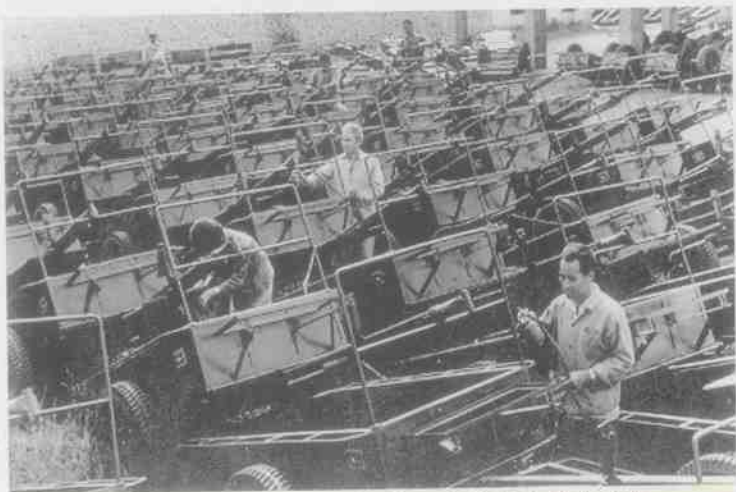
20世纪70年代柳江县机械厂生产的手扶拖拉机