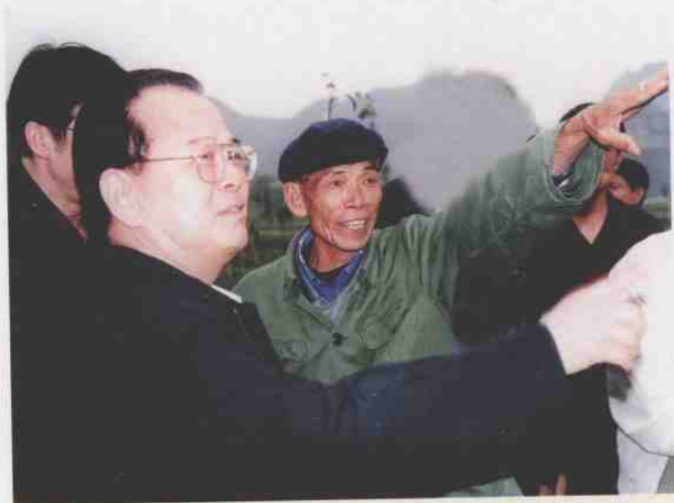
2002年4月8日，自治区党委书记曹伯纯到柳江县百朋镇怀洪村委与农民“三同”。图为曹书记（左一）在怀洪村委六义屯绿化苗木基地指导工作。