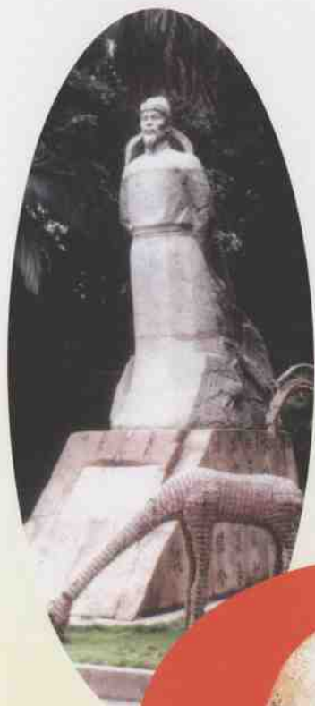
屹立于柳侯公 园门前的柳宗元塑 像