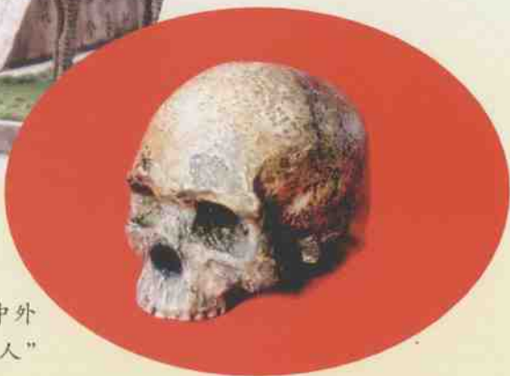
闻名中外 的“柳江人” 头骨化石