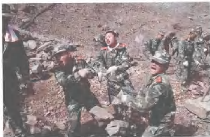
奋力抢修铅丝笼护坡