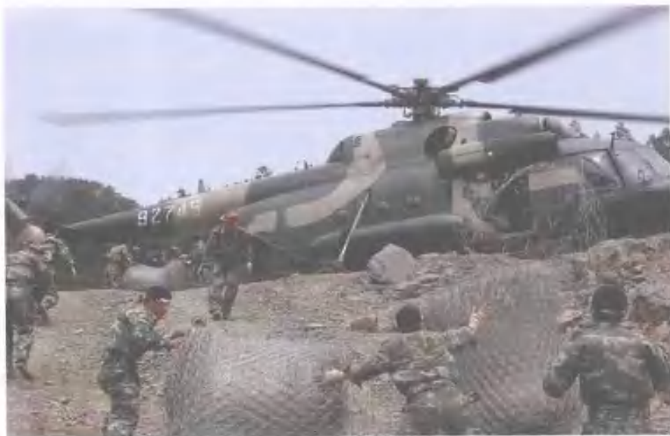
战士在螺旋桨强大气流下卸载直升机运来的工程物资