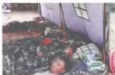
和衣睡一会儿 ▶ 官兵们每天的伙食就是方便面和饼干 ▼