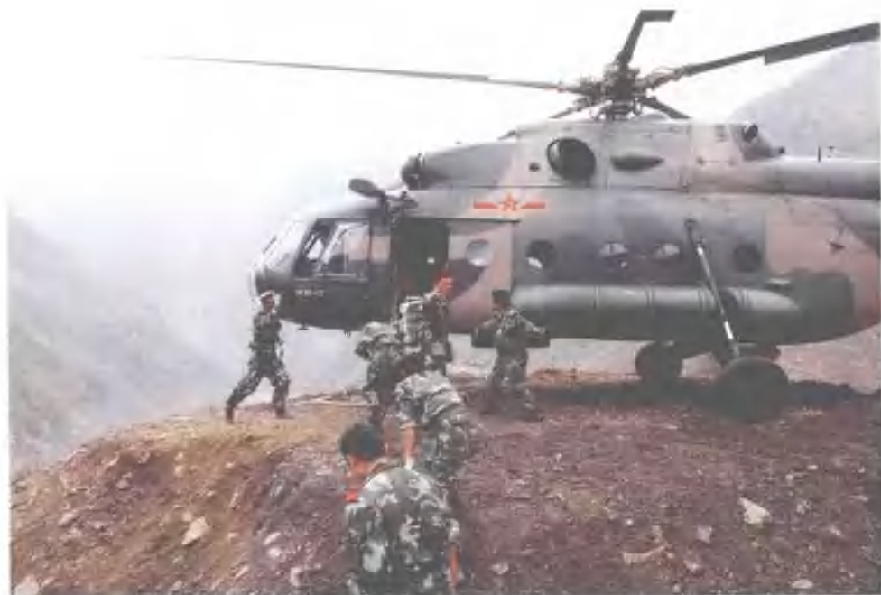
部分武警水电官兵空运至排险现场