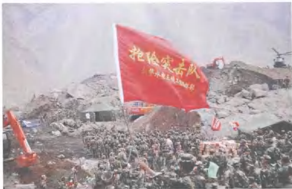
部分武警水电官兵徒步到达垭顶