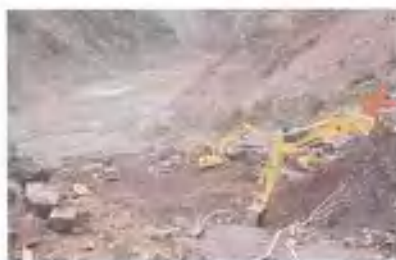
争分夺秒开挖泄流槽