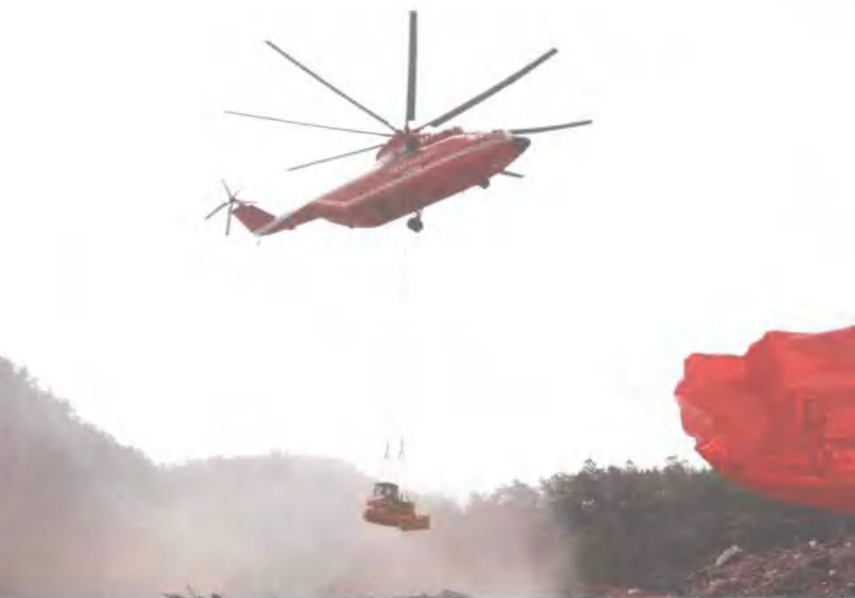
直升机正在空降武警水电部队重型机械设备