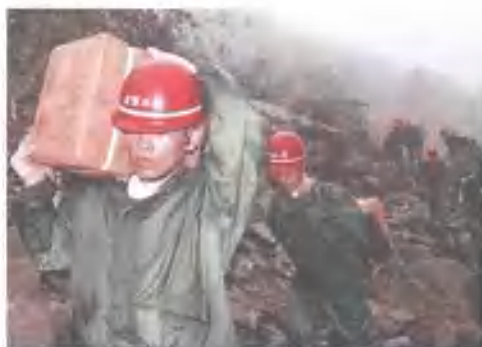
◀ 武警水电部队官兵肩扛炸药向堰塞湖进发