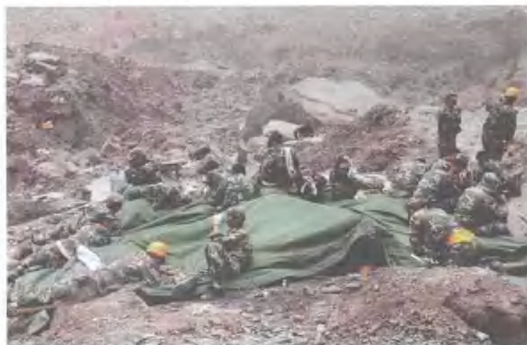
直升机起降的巨大气流使地面飞沙走石