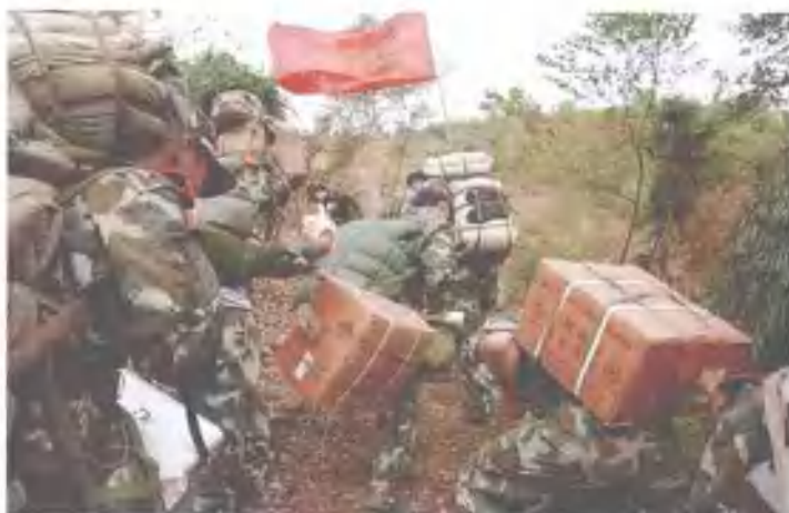
▲ 5月26日，武警水电部队组织400余名突击队员，身背雷管、炸药和背包，从北川县城徒步翻山越岭，赴唐家山堰塞湖执行抢险任务。