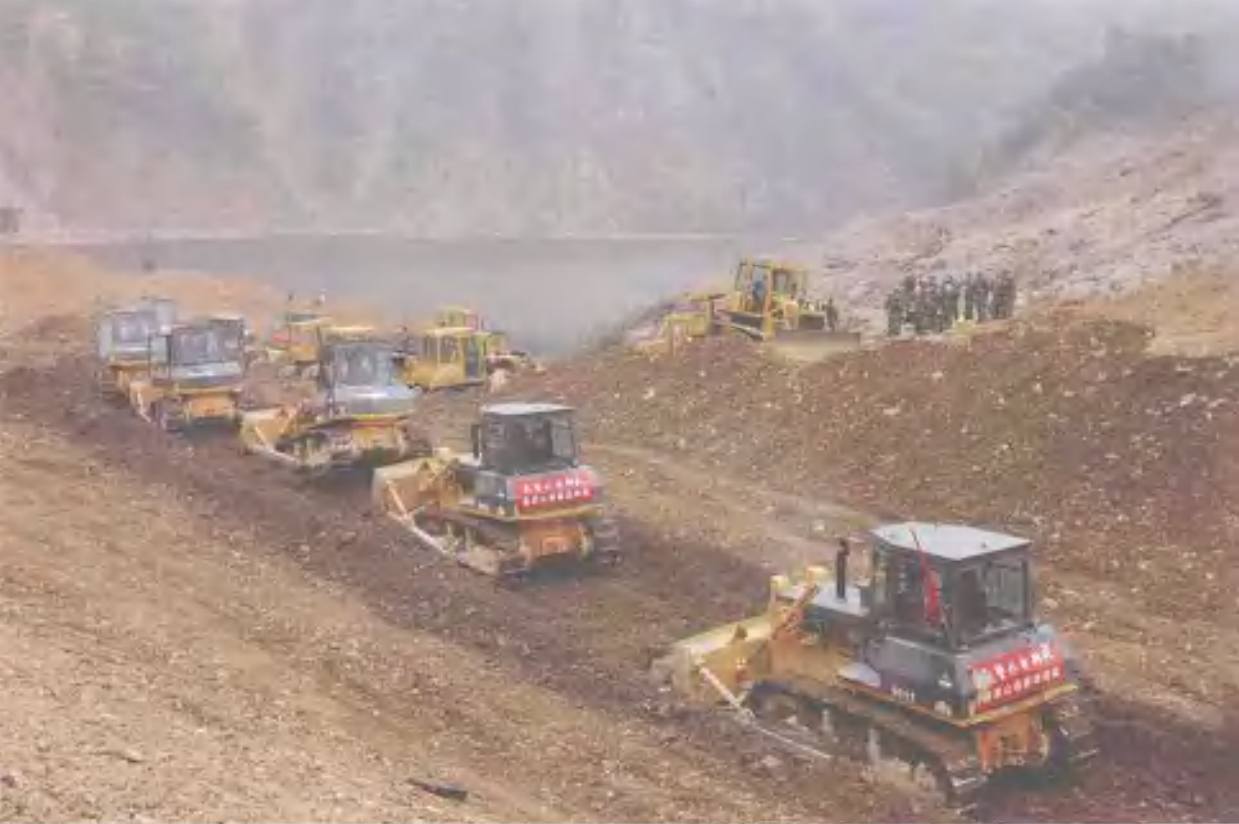
大型机械在唐家山堰塞湖抢险现场进行泄流槽施工