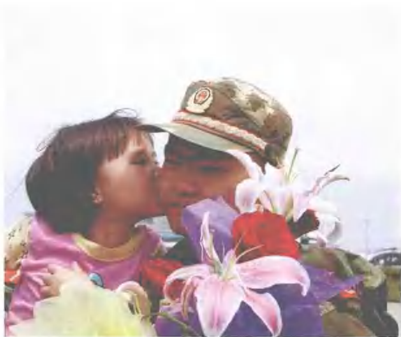
绵阳人民欢迎唐家山堰塞湖抢险的英雄归来