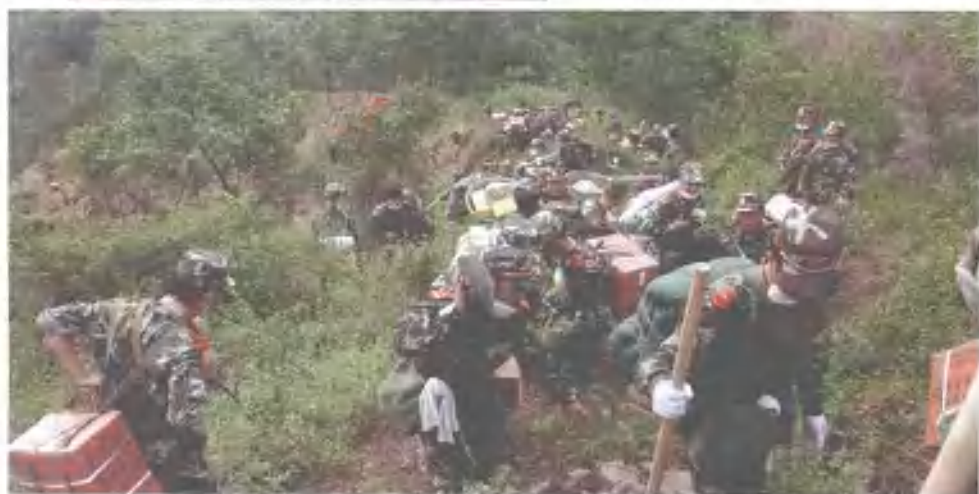
▼ 官兵们艰难攀登近70度的陡坡