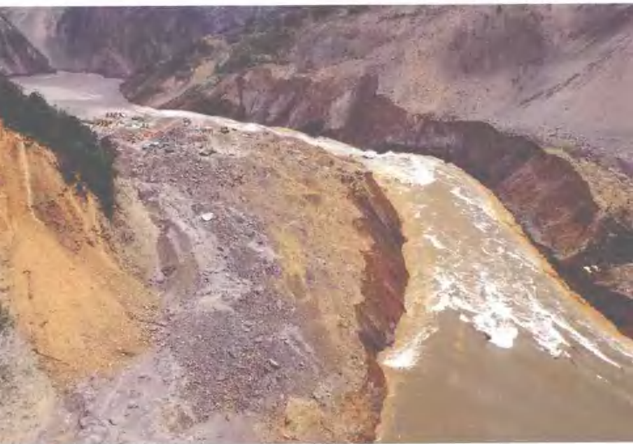
唐家山堰塞湖成功泄流