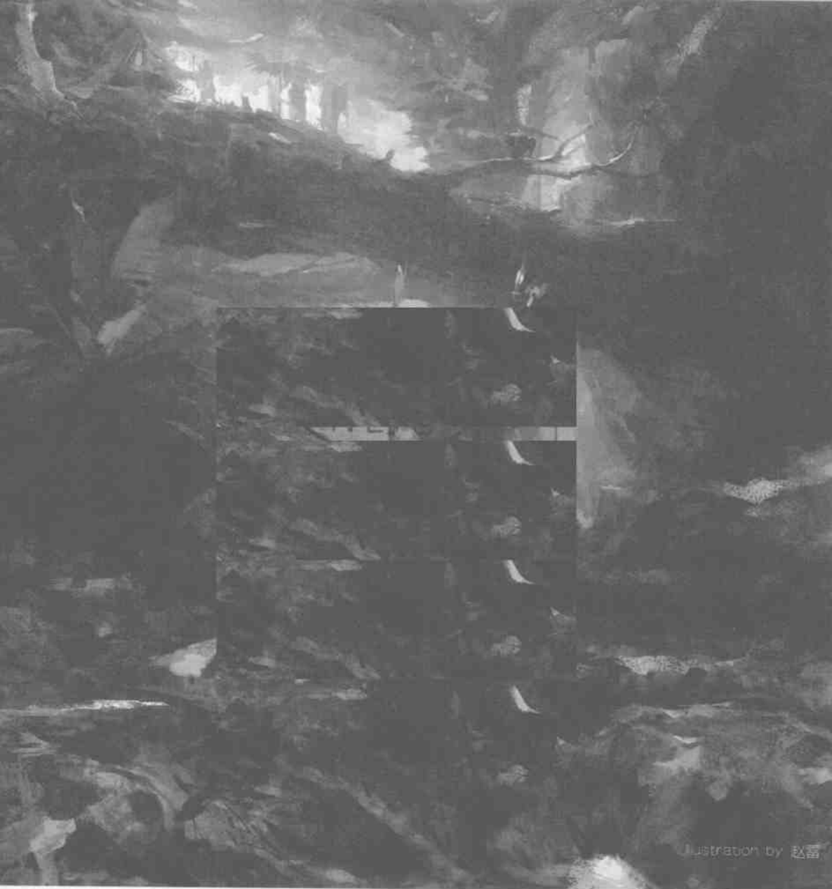
Illustration by 赵雷