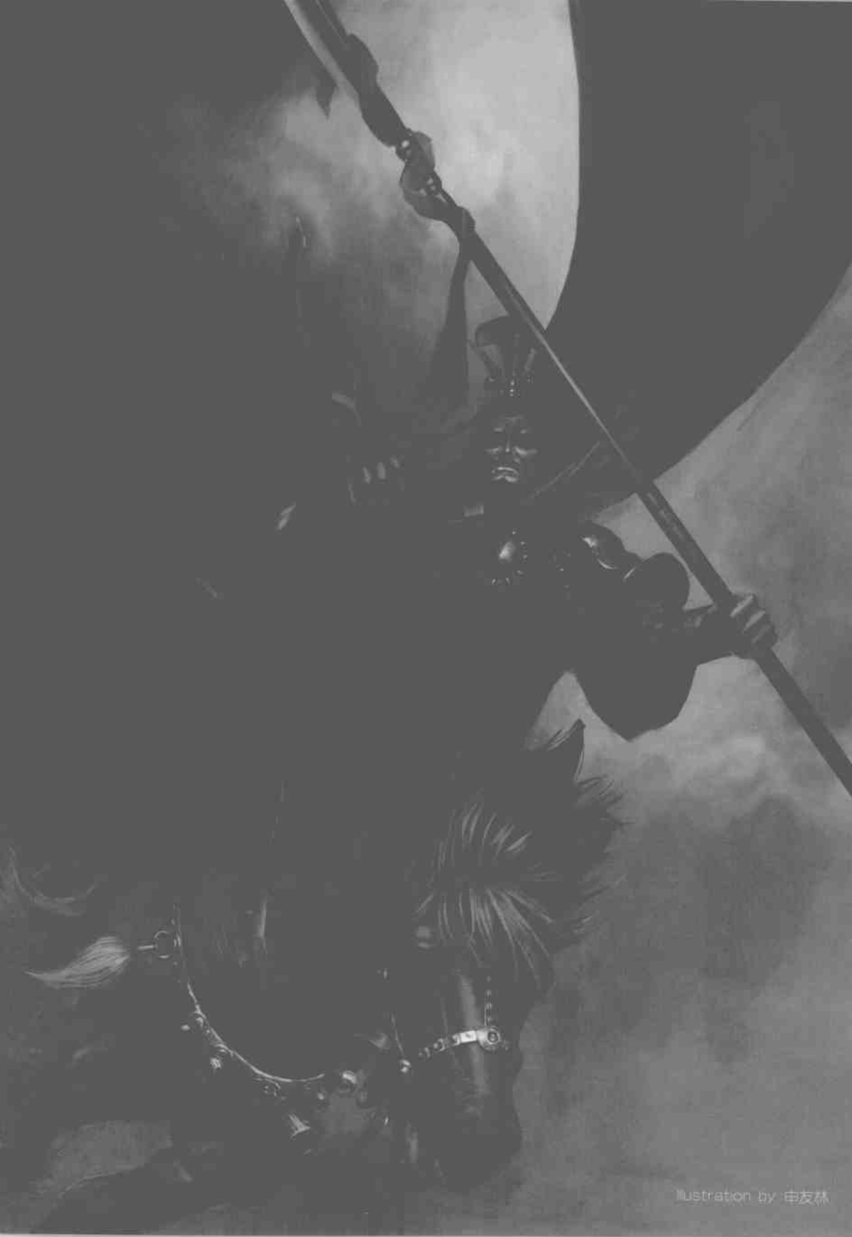
Illustration by 申友林