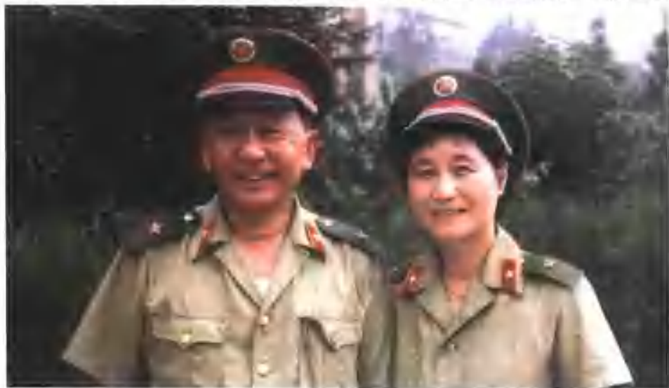
1988年7月，王诚汉被授予上将军衔前夕，与夫人黄丽文留影

交通、通信等历史因素和发展状况，要有利于作战指挥，便于组织部队向其他战区机动，因此在设置上应具有一定的弹性和稳定性，不宜过于靠前。”在信中，王诚汉还从四川和成都在西南的政治、经济、军事地位，从西南战区的作战指挥，从战区的后勤物资保障，从现有设施的利用和减少投资，从军区空军的作战任务和指挥位置等8个方面，陈述了军区定点由昆明改为成都的优越性。说理比较充分，论证比较清晰。军委邓小平等领导同志在广泛听取意见的基础上，采纳了王诚汉的荐言，当即在会上作出了改原定点昆明为定点成都的决定。王诚汉为这一决定感到