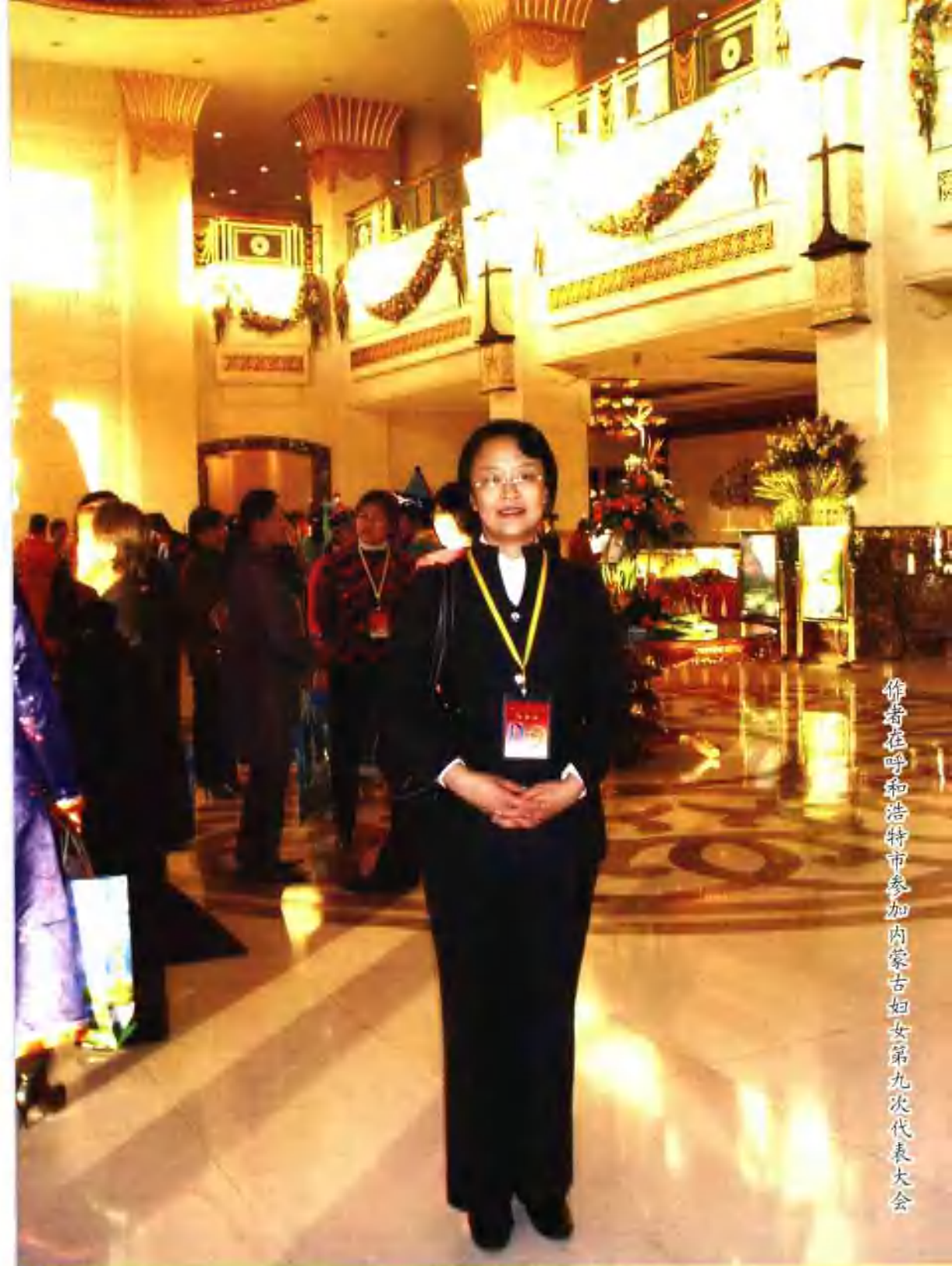
作者在呼和浩特市参加内蒙古妇女第九次代表大会