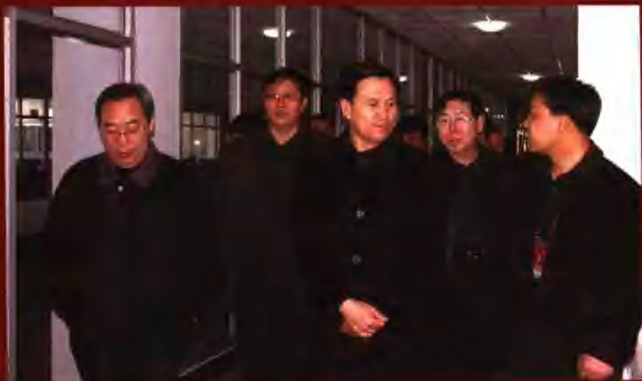
自治区主席杨晶（前排中）在盟委书记崔国柱（左一）、盟长常海（左二）、乌市市长尤国钧（右二）陪同下到蒙牛乌兰浩特公司视察。