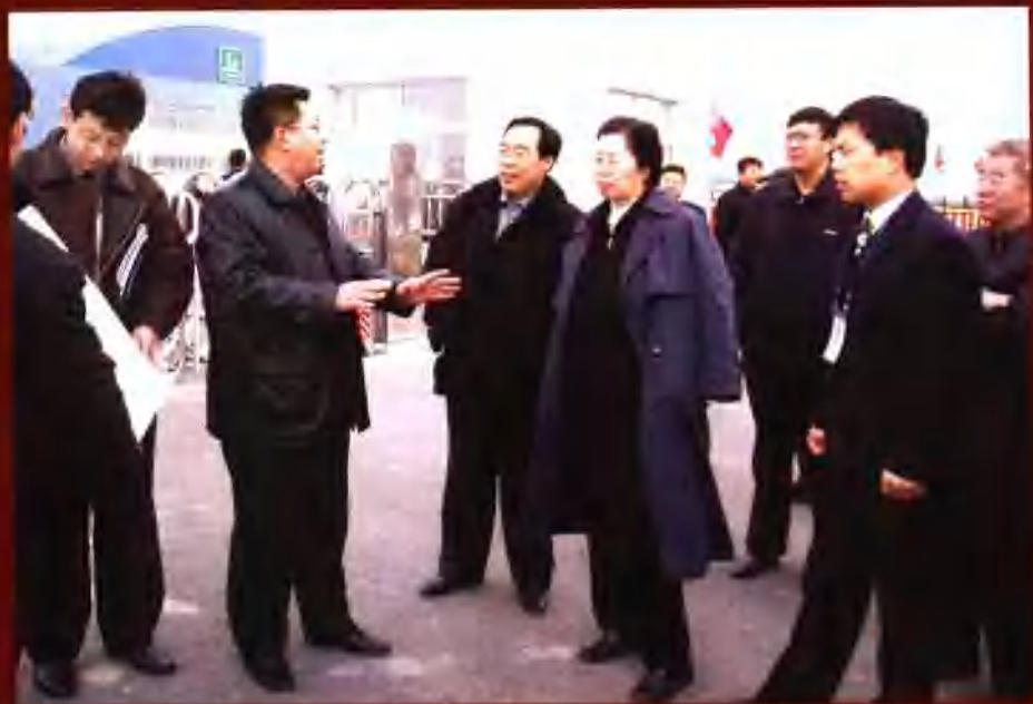
自治区党委常委、组织部长陈朋山（前排右二）在乌市经济技术开发区视察。