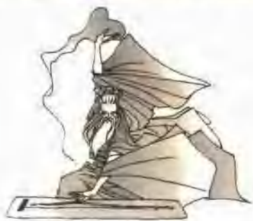
图 现 金庸武学