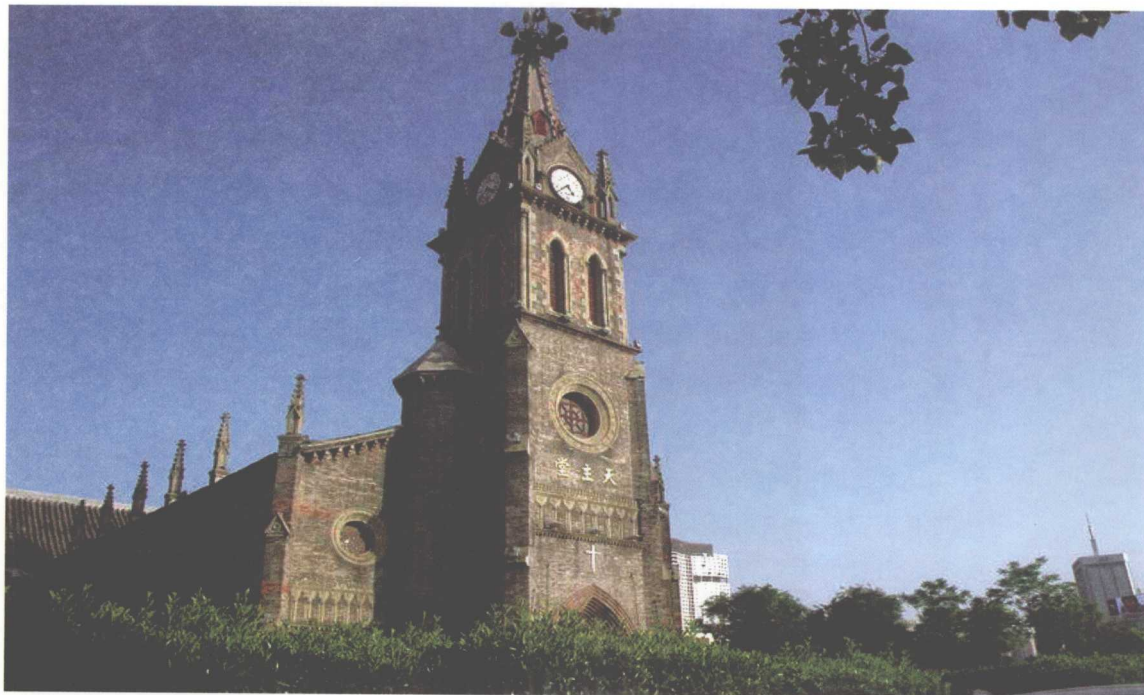
◎宁波三江口的天主教堂。

艰难多了。一方面，你们是一对相互忠诚又相敬如宾的夫妻，从小到大，我从来没有看到你们当着我们儿女的面吵过一次嘴，也从来没有听见你们在背后对对方有任何不敬的言语。而另一方面，在我很小的时候，就知道有一些东西，像玻璃碎片一样撒在生活的外围，不小心就会伤及我们的家庭，你们由此变得小心翼翼，非常时刻则战战兢兢，如履薄冰。此刻，父亲去世二十余年了，我仔细回想你们在一起时的生活，想起你们和我们一起庄严度过的八一建军节、七一党的生日，包括六一儿童节……可一次也想不起你们互相戏谑玩笑的场景。我知道，那并不是你们生性严肃。它是一种外来的东西，渐渐地渗透了你们，直到有一天终于成了你们生命的一部分。