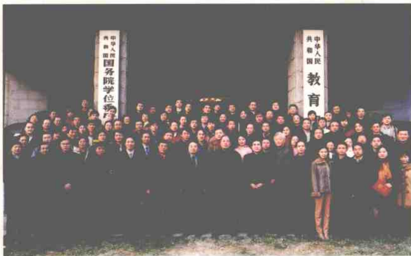
教育部领导与中央暨首都新闻单位记者合影