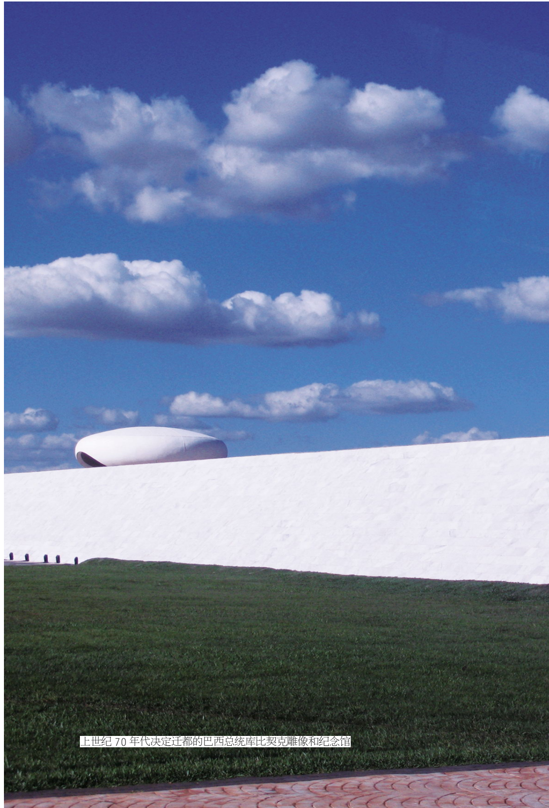
上世纪 70 年代决定迁都的巴西总统库比契克雕像和纪念馆