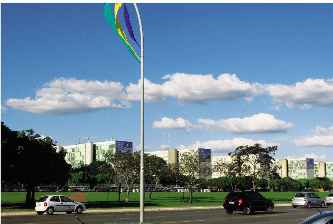
巴西利亚政府各部的办公大楼,排列在“飞机”状城市设计的公务舱位置

“金砖四国”,近几年来经济上共同发展,费尔南多校长对中巴教育之间的相同之处非常有感触,建筑和艺术也是巴西需求最大的学科,基于发展的原因,建筑工程师的需求量是所有专业里最大的。圣犹他大学的合作伙伴多为中小型企业,这一目标的选择,使其在当地的声望日益提高,用中国教育界的行话来说,“产学研”的结合已经达到了一定的高度。