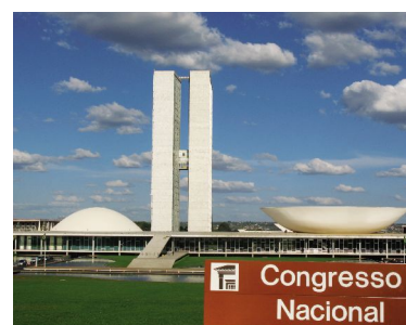
位于巴西利亚城市设计飞机形状机头部位的议会大楼,中间为两栋相连的办公大楼,左右两只碗,朝上意为承天意,朝下为顺民意