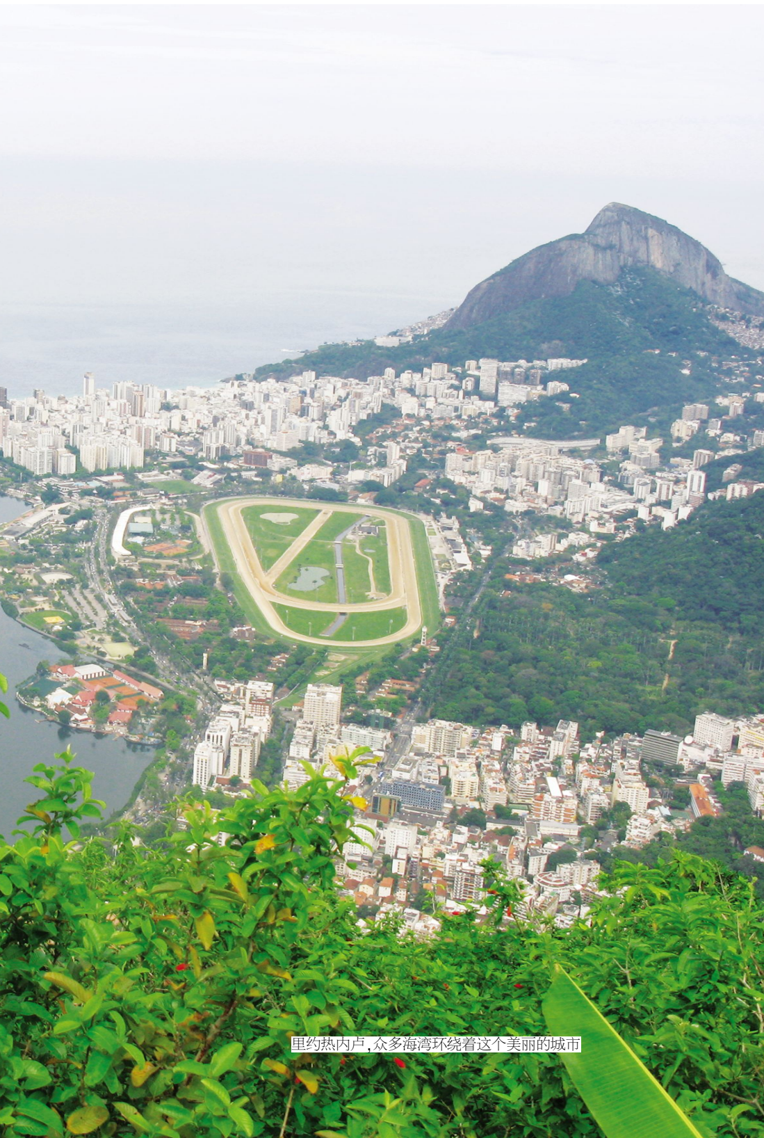
里约热内卢, 众多海湾环绕着这个美丽的城市