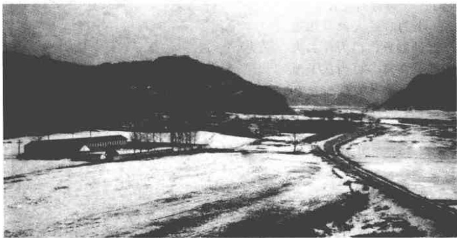
在那遥远的小山村——湾柳河（作者出生地）

我知道人生传奇也好，笔架山也好，柳鱼也好，请乐队也好，其实这与个人的成长没有必然的联系的话，不过是一种巧合罢了。如果非要联系，父母经常的念叨，也许会起一种心理暗示的作用。但这不是根本原因，真正对我产生影响的是父母那种自强不息，吃苦耐劳，与命运抗争的精神。是正直、善良、自尊、刚强，“宁折不弯”性格的传承，是从小严格的家庭教育为我打下了人生的底色，这是最大的一笔财富。是我取之不尽用之不竭的无价之宝。