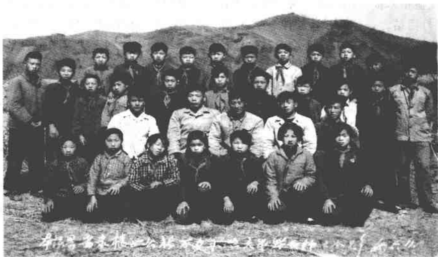
带着少年的梦想告别小学学习生活

因为我喜欢读书，1970年曾被当时下乡在我们队的“五七”干部工作队抓了典型，挨过批，说我追随“封资修”，是资产阶级的小爬虫。几次批判我，还把我的藏书全部收缴。当时我困惑的是，为什么把我的书收走后，不让我看，可他们在看，很多人还把我的书剪了当卷烟纸。每每看到那种场景，真是怒火满腔。