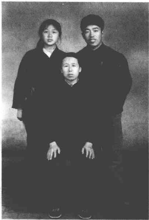
1976年与母亲和三妹在一起