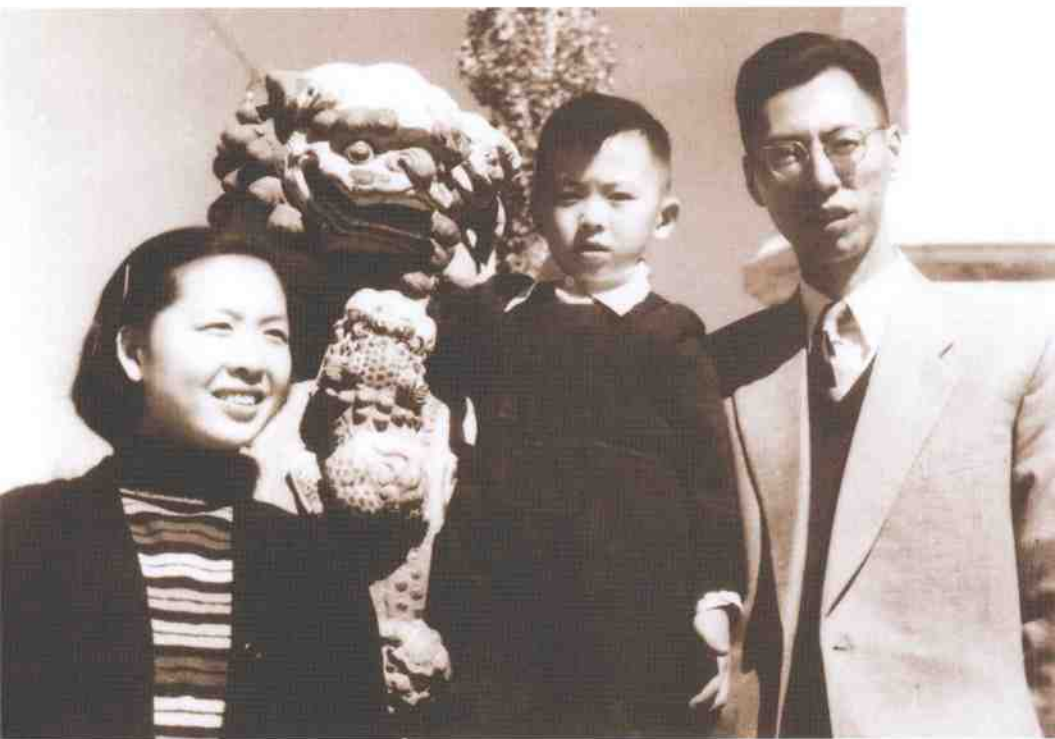
来宁夏的第一张照片