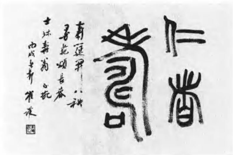
崔汉 著名画家、书法家、诗人。