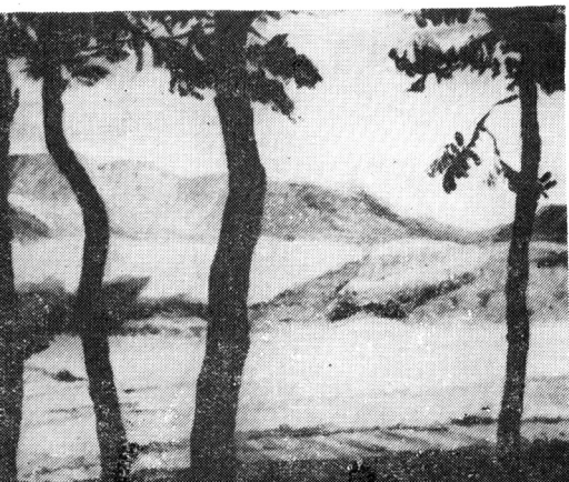
白 荡 湖