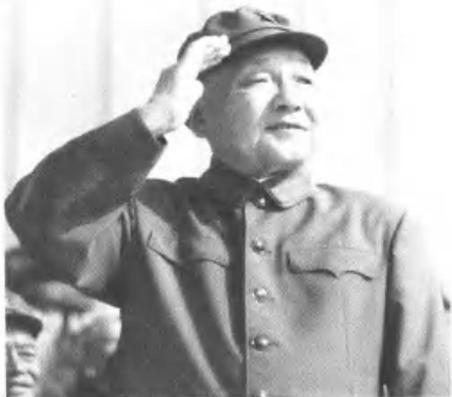
邓小平、胡耀邦等党和国家领导人在华北军事演习阅兵主席台上检阅部队