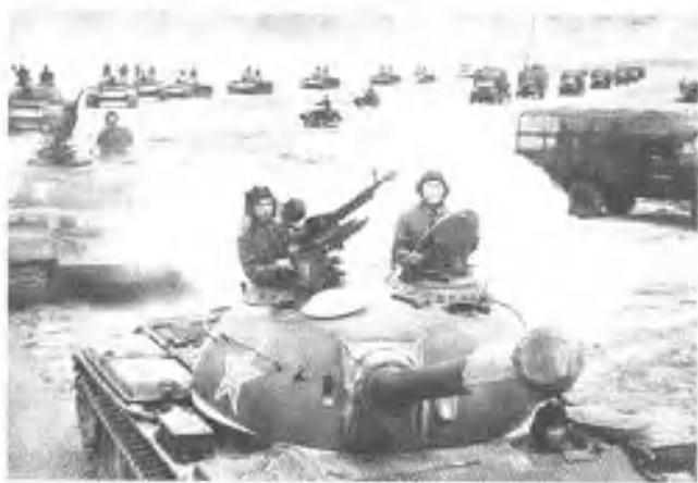
激战中“红军”二梯队加入战斗