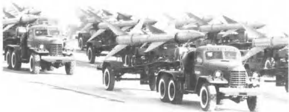
地空导弹方队通过主席台接受检阅