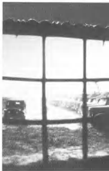
野营帐篷城