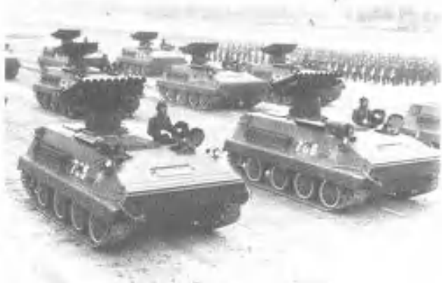
自行火炮方队接受检阅通过主席台