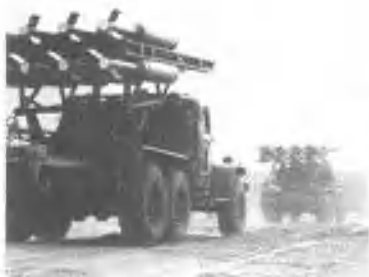
火箭布雷车奔赴发射地域