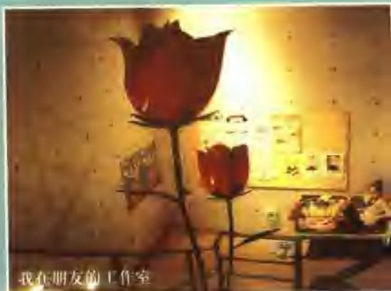
我在朋友的工作室