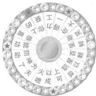
图一 书中的魔力大转盘底图