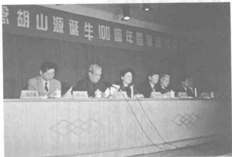
1997年11月20日纪念胡山源诞生100周年暨学术讨论会在 江阴召开