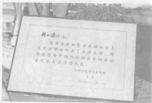
巴金簽署的“中國作協第四次會員代表大會名譽代表証”