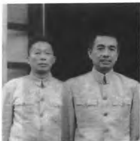
陶铸与冯白驹（左）摄于 1956年。