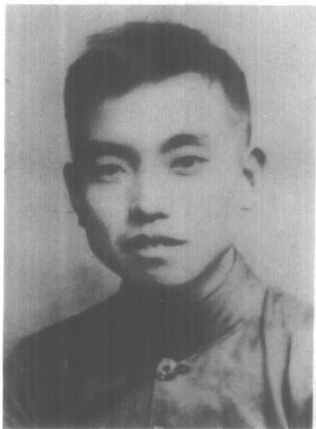
红六军团军团长肖克