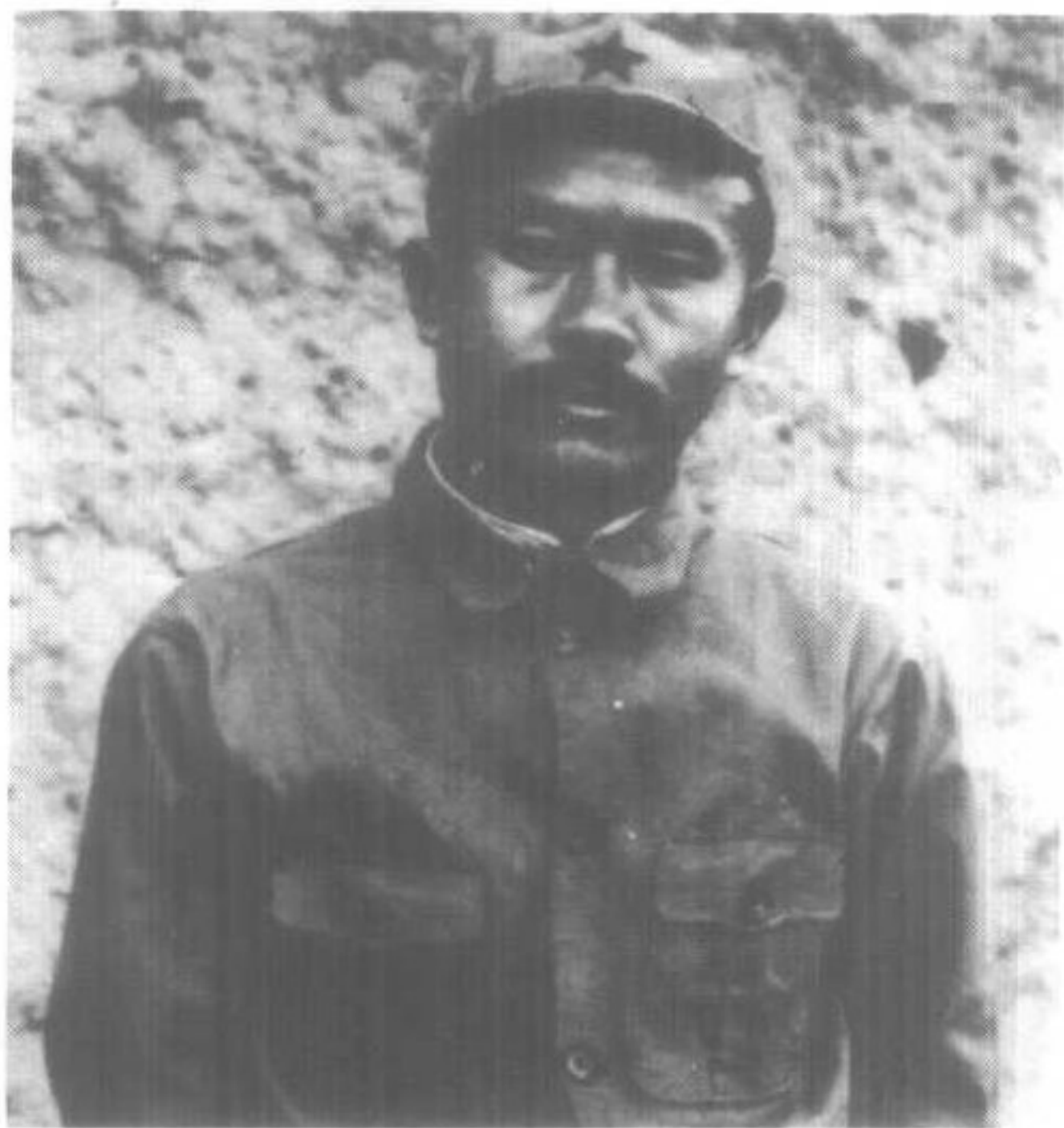
红六军团军政委员会主席任弼时