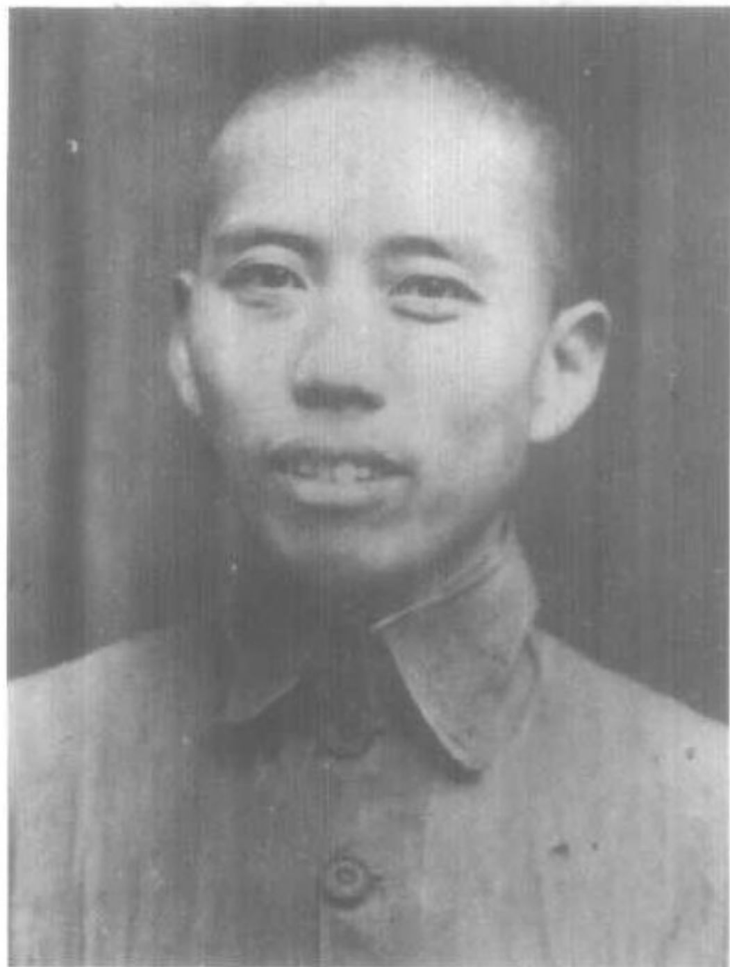
红六军团参谋长李达