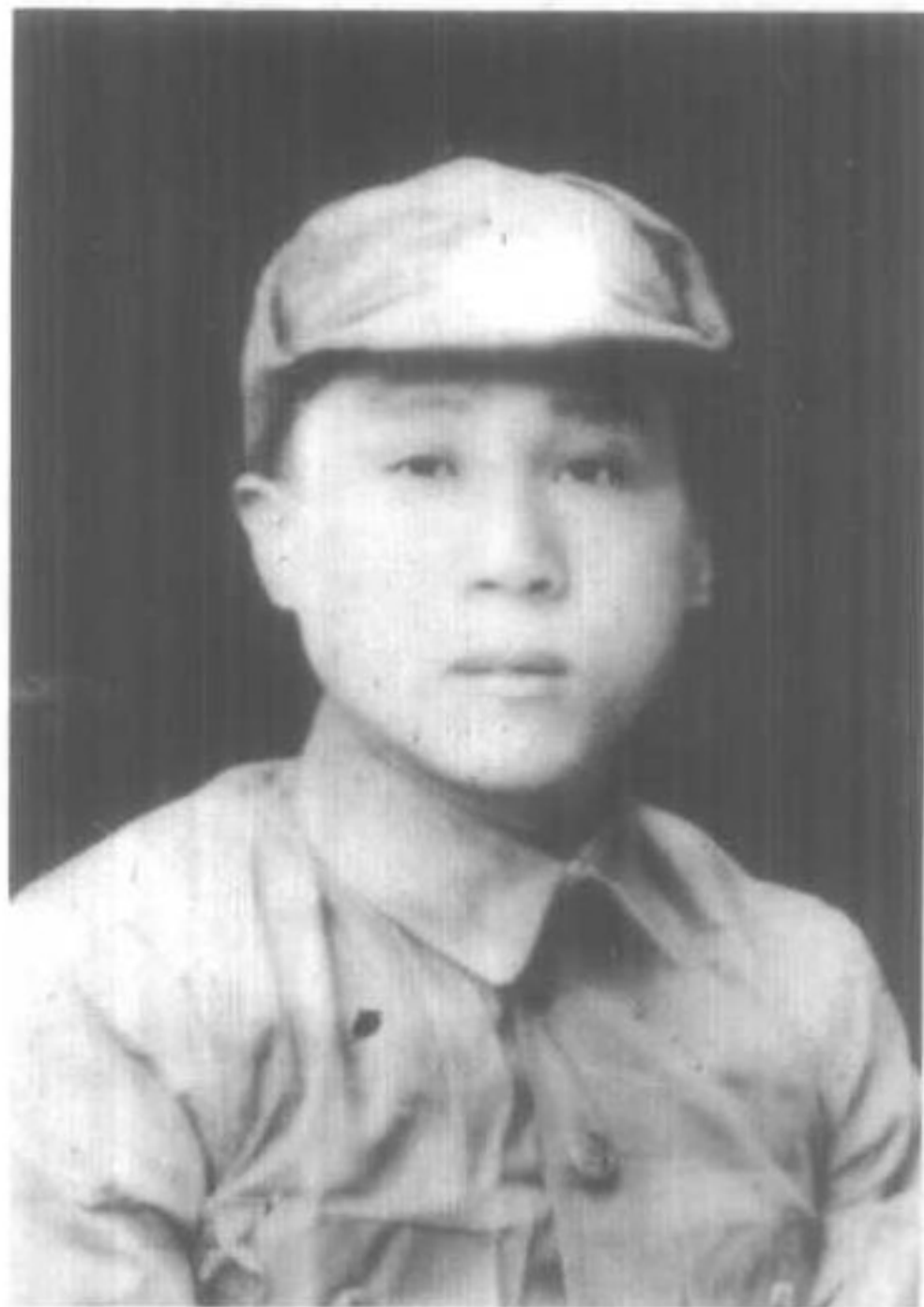
红六军团政治部主任夏曦