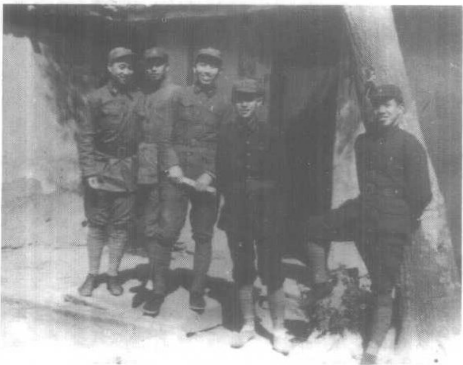
1937年红二方面军部分干部合影。右起：陈伯钧、关向应、王震、肖克、甘泗淇。