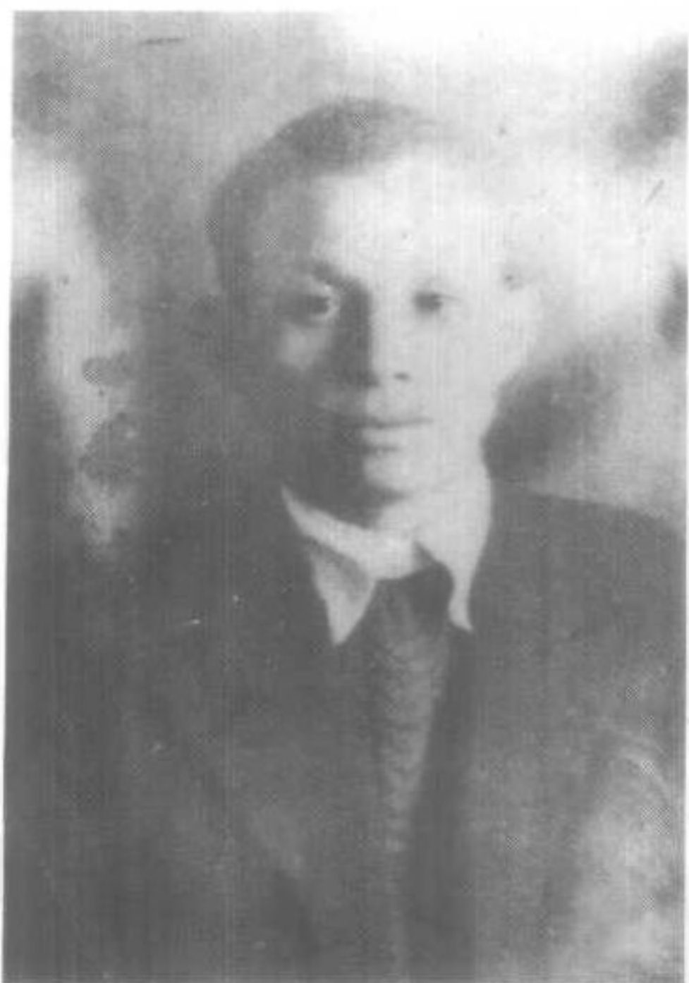
红六军团参谋长谭家述