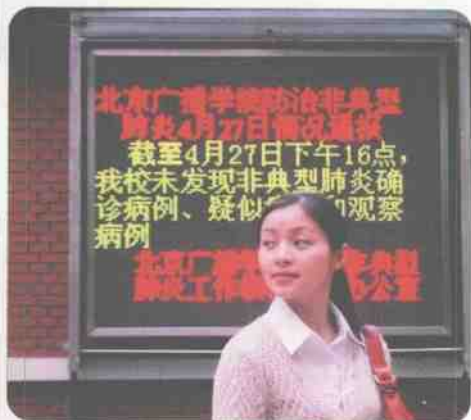
▲ 北京高校每日向学生通报最新疫情。