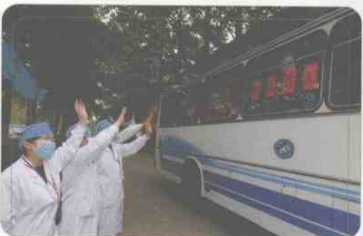
▲ 北京大兴，首都高校师生“非典”防控隔离观察中心，又一批学生解除隔离，返校复课。