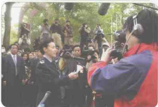
▲ 走出隔离区。2003年5月8日，北方交通大学交大嘉园学生公寓的1、2、3号楼解除隔离控制。