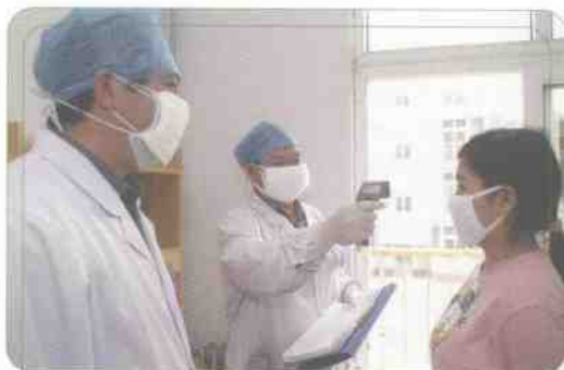
▲ 学校医护人员每天数次对隔离区内的学生进行检查、测温。