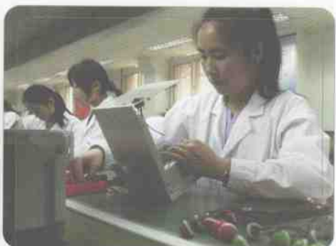
▲ 北京第一个红外快速体温检测仪生产基地在清华大学投产。图为生产线上工人们正在夜以继日地组装检测仪。