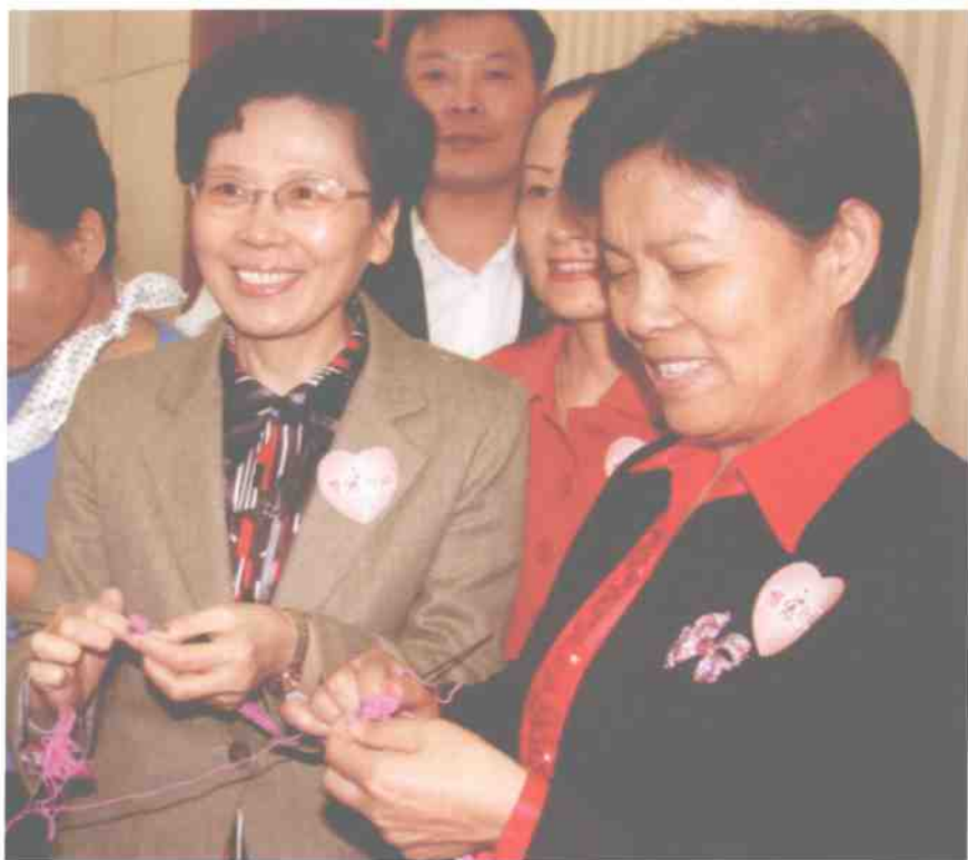
全国妇联党组书记、全国妇联副主席、书记处第一书记黄晴宜（右二） 全国妇联副主席、书记处书记莫文秀（右一）身体力行 加入到“恒爱行动”中来