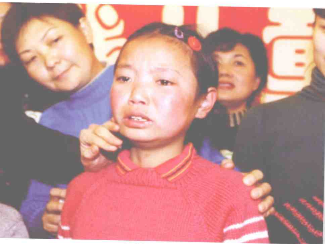
穿上爱心毛衣的孩子哭了