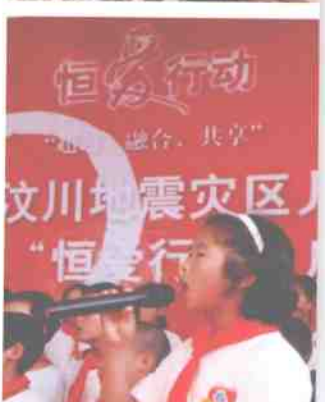
“恒爱行动”情系灾区儿童