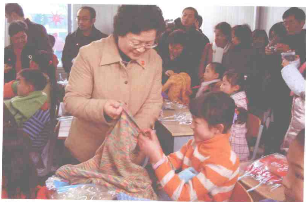
全国妇联副主席甄珉为都江堰市蒲阳板房小学孩子穿上爱心毛衣

2008年12月5日，国家民政部在北京人民大会堂隆重举行2008年度“中华慈善奖”颁奖典礼，重点表彰2008年度在慈善活动中有突出表现的企业、个人和慈善组织。恒源祥集团董事长刘瑞旗荣获“中华慈善奖——最具爱心慈善行为楷模”；被誉为中国关爱孤残儿童第一品牌的慈善活动——“恒爱行动”荣获“中华慈善奖——最具影响力慈善项目”。刘瑞旗董事长、陈忠伟副总经理还受到了国家主席胡锦涛、国务院副总理李克强、回良玉等党和国家领导人的亲切接见。