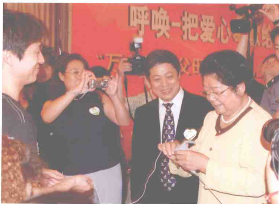
时任全国人大常委会副委员长、全国妇联主席顾秀莲在北京“恒爱行动”新闻发布会暨启动仪式上亲自动手起棒针织毛衣，为孤残儿童献爱心