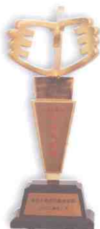
2008年“恒爱行动”获中华慈善奖奖杯及证书