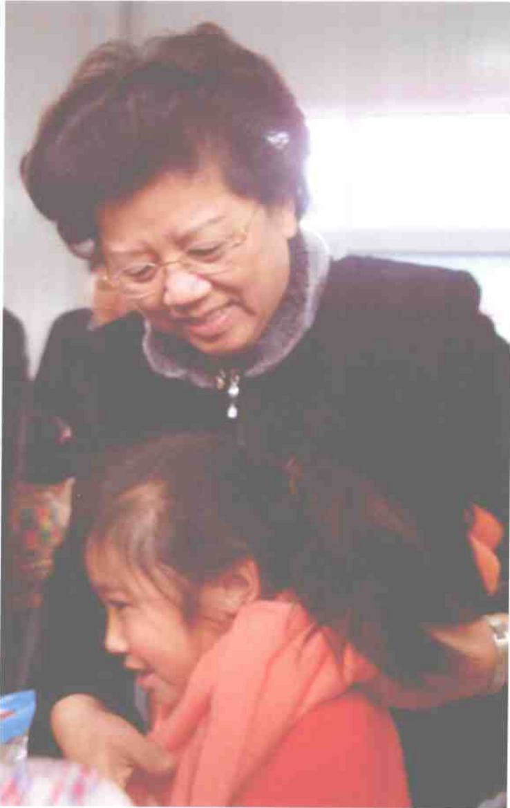
全国人大副委员长、全国妇联主席陈至立为都江堰市蒲阳板房小学孩子穿上爱心毛衣