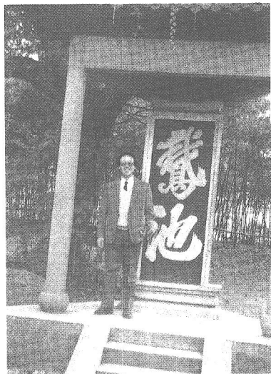
1996年秋摄于绍兴兰亭