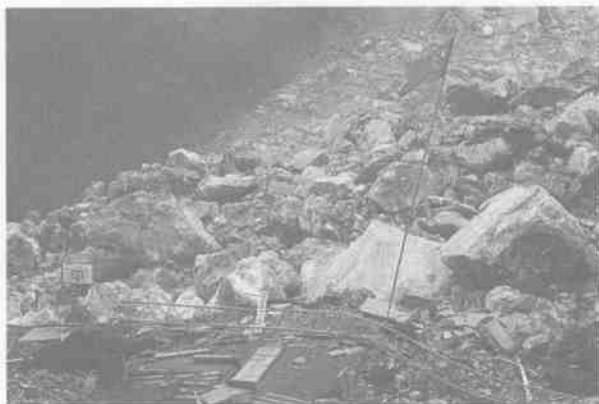
地震后的北川中学。