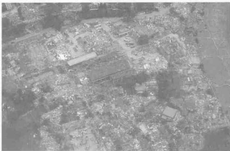
地震后的汶川县映秀镇。