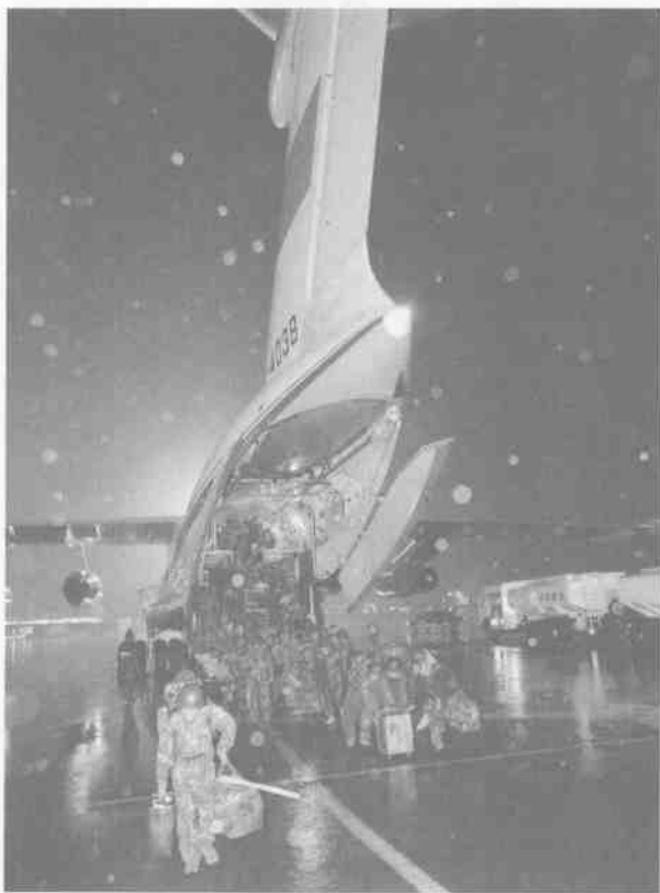
2008年5月12日下午5时，从北京赶赴汶川救灾的部队正在登机。