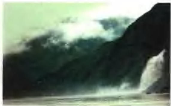
▲ 白龙过江