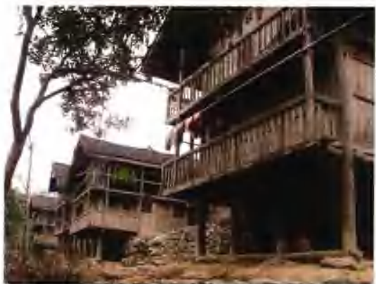
▲ 沿河清代土家民居——鲤鱼池吊脚楼