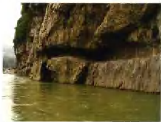
▲ 乌江山峡古纤道