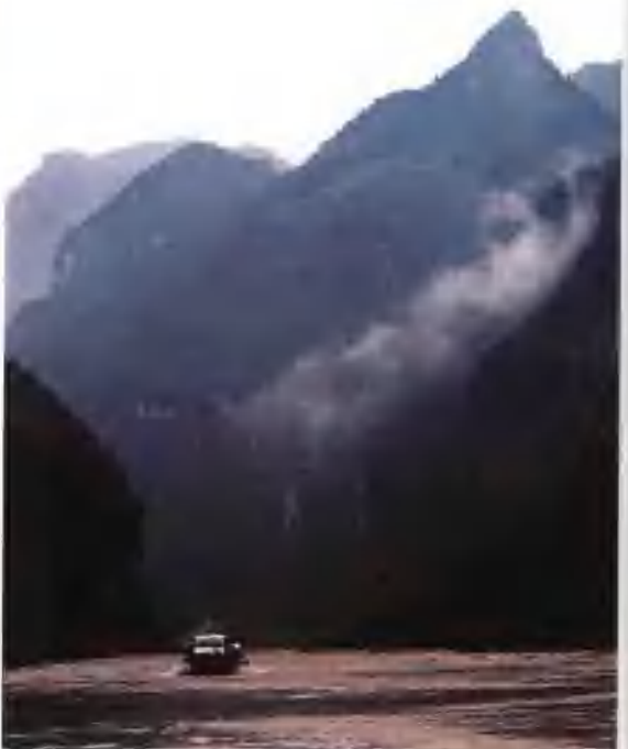
▲ 乘风破浪穿奇峡