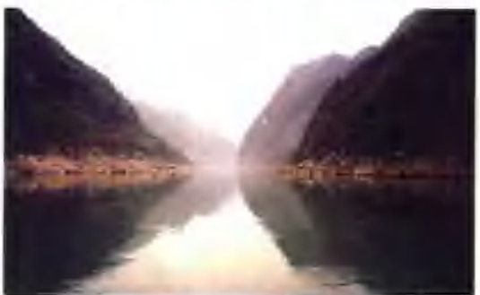
▲ 银董峡景色迷人