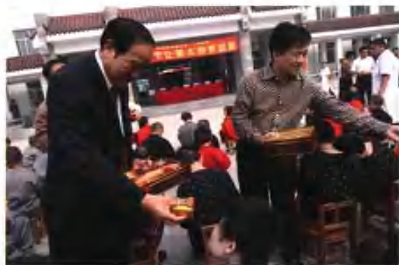
中秋节前夕与省人大常委会副主任李志斌（左）一起慰问福利院孤儿