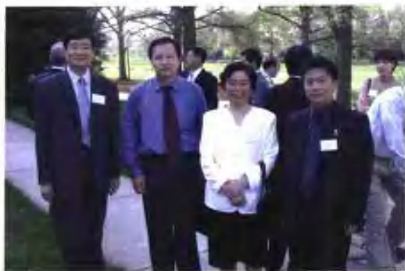
与王菊梅副省长（右二）等在马里兰大学合影