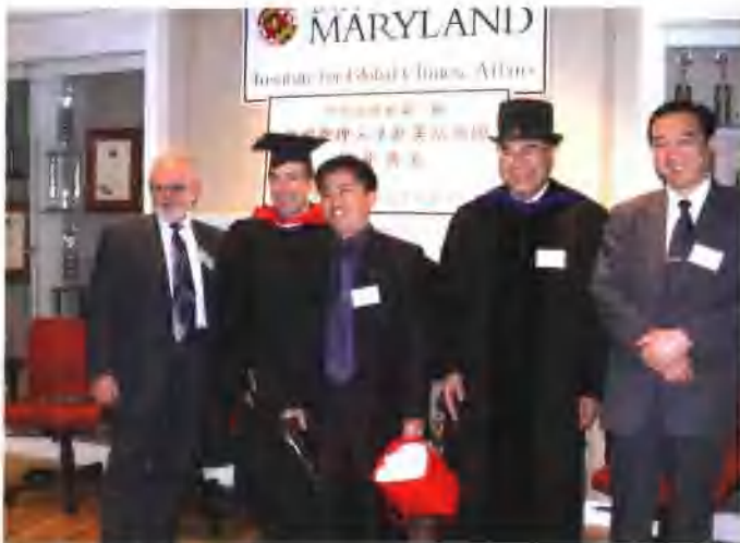
在马里兰大学培训结业典礼上领取结业证书，右一为时任河南省委常委、组织部长。现任河南省委副书记陈全国，右二为马里兰大学副校长刘春生教授