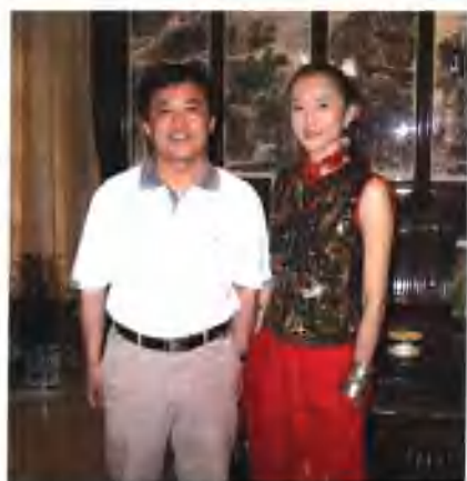
与著名舞蹈艺术家杨丽萍（右）合影