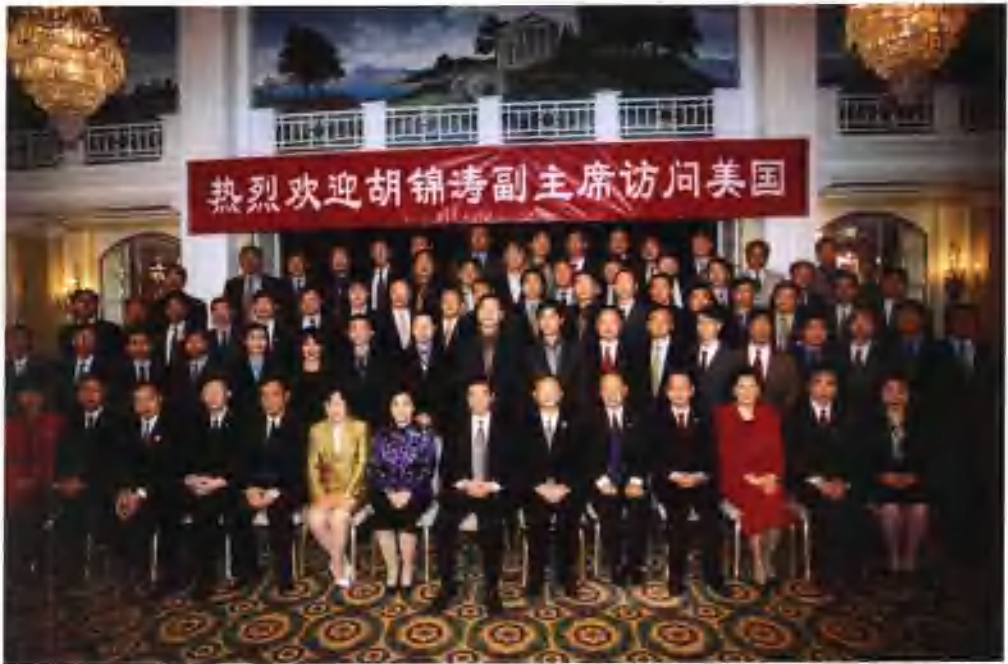
2002年4月30日，时任国家副主席胡锦涛在华盛顿亲切接见华人华侨和留学生代表，河南二期赴美培训班全体学员受到亲切接见