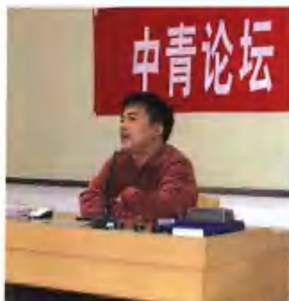
在省委党校第40期中青班中青论坛上做文化河南的主题演讲