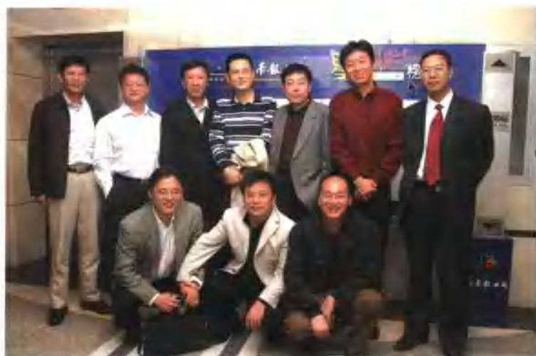
与全国门户网站掌门人