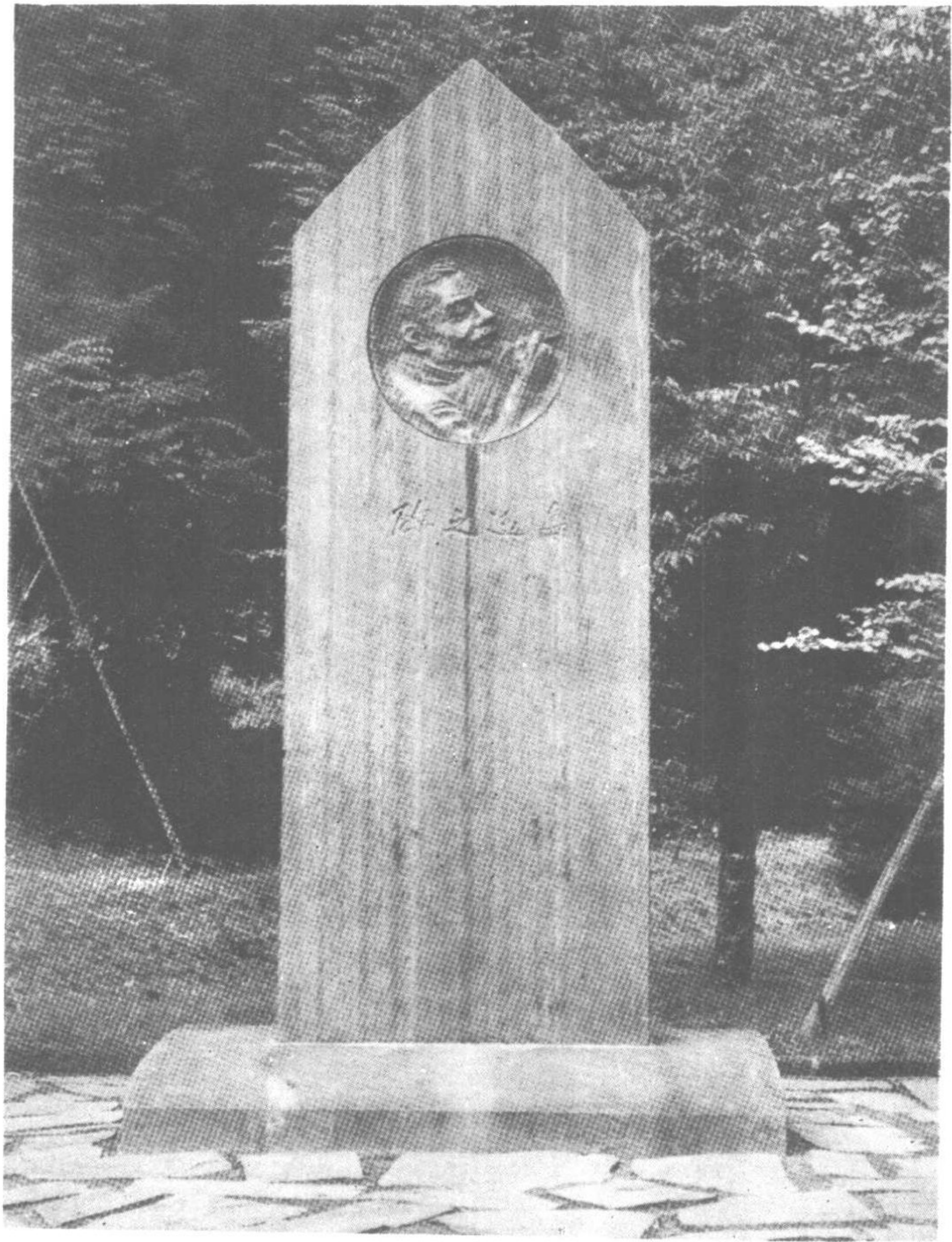
仙台市的鲁迅之碑（一九六〇年十二月完成）