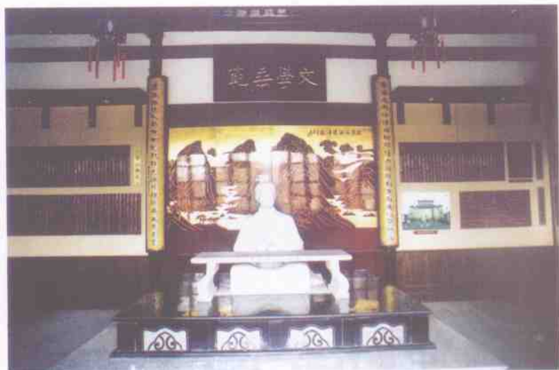
南郊风景区读书台