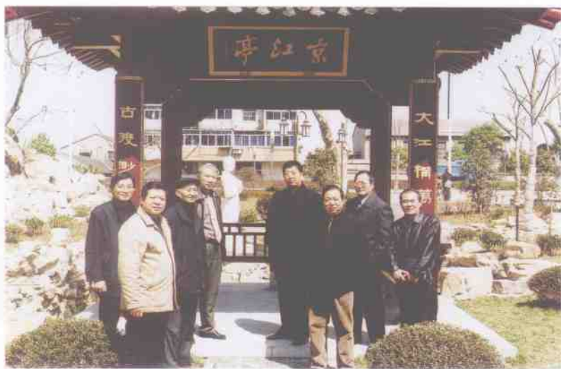
编委会成员在景区采风，图为蒜山公园京江亭