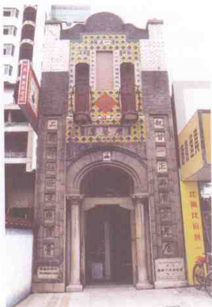
五条街唐老一正斋