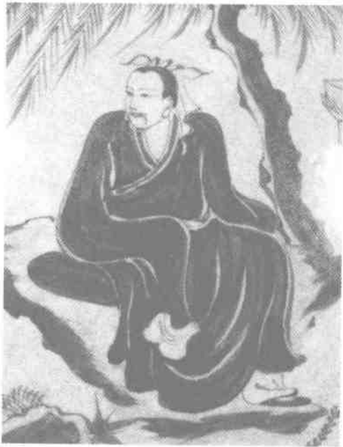
—青花三顾茅庐图大扁壶上的诸葛亮