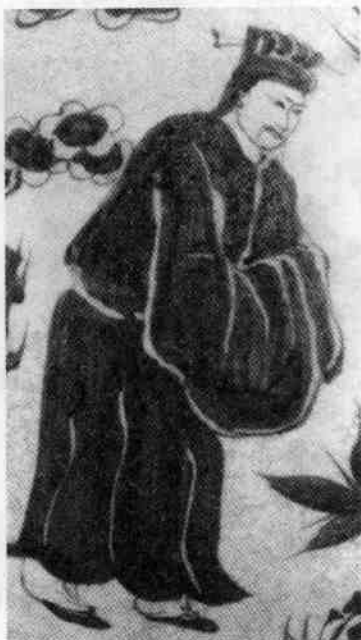
—青花三顾茅庐图大扁壶上的刘备

在汉族的文化理念里，儒家是“阳”、是“正”（正位）、是“常”（常规的能力），而道家则是“阴”、是“副”（副位）、是“变”（变化、超常的能力）。