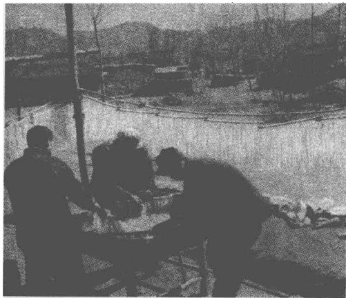
互助合作时期的西铺村民

“农民在土地改革基础上所发扬起来的生产积极性，表现在两个方面：一方面是个体经济的积极性，另一方面是劳动互助的积极性。”“党中央从来认为要克服很多农民在分散经营中所发生的困难，要使广大贫困的农民能够迅速地增加生产而走上丰衣足食的道路，要使国家得到比现在多得多的商品粮食及其他工业原料，同时也就提高农民的购买