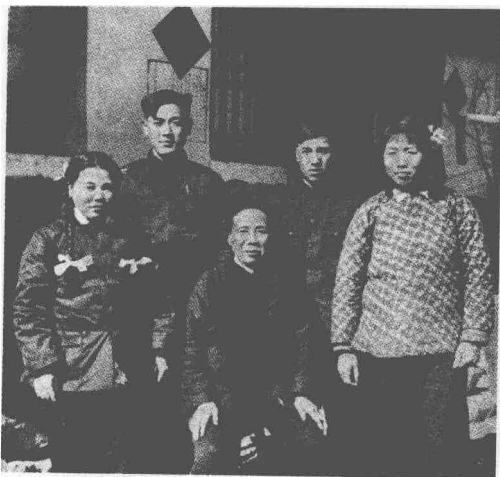
合作社时期的西铺村农民家庭