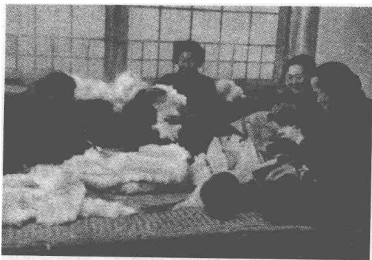
互助合作时期的西铺村民

愿互利的原则，坚持积极领导、稳步前进的方针。并且指出，应继续切实照顾单干农民的生产积极性并帮助他们克服困难，发展生产，发挥他们的生产潜力，任何歧视和打击个体农民的行为都是错误的。