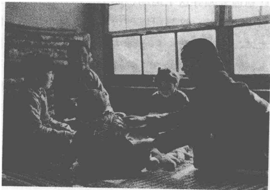
农业合作社时期的西铺村民

这年6月下旬，毛泽东从南方考察回京后，对农村形势和农业合作化的发展方针做出了新的思考和判断。他主张修改计划，加快发展，在原定的