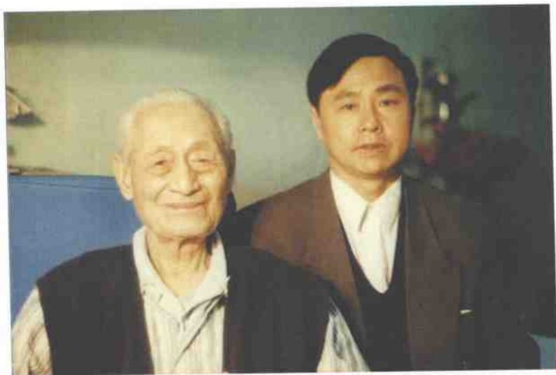
作者1998年在北京医院与赵朴初公合影