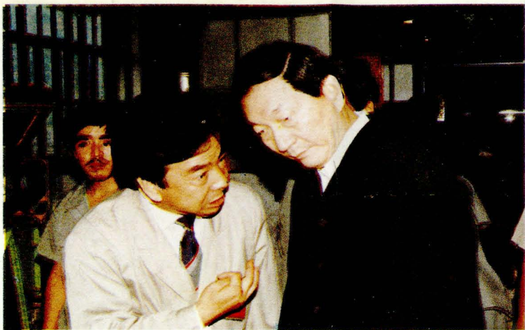
朱镕基副总理 视察延安卷烟 厂，厂长孙焯 现场介绍。