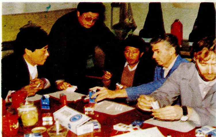
延烟深受国内 外消费者青睐