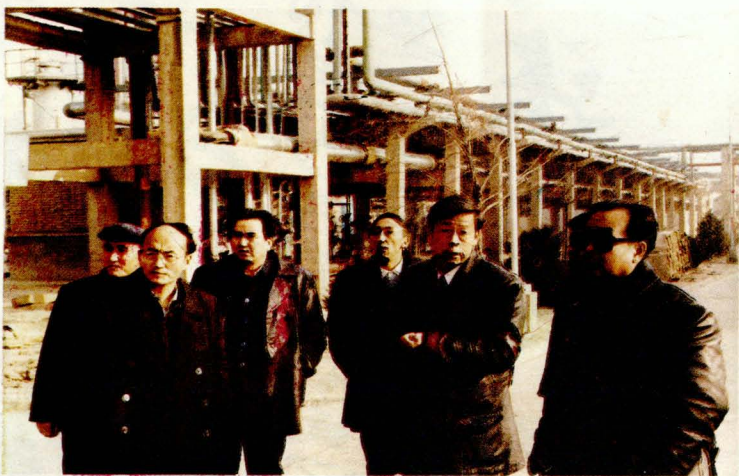
延长油矿管理局领导在延炼现场办公