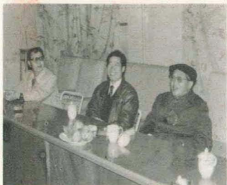
本书作者随广播电影电视部部长艾知生(右)、副部长同向荣(中)在延安。