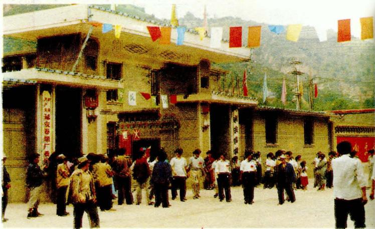
这里总是 喜气洋洋 (延烟正门)