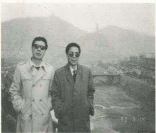
作者与前来视察的陕西人民广播电台台长纪时(右)于延水河畔。