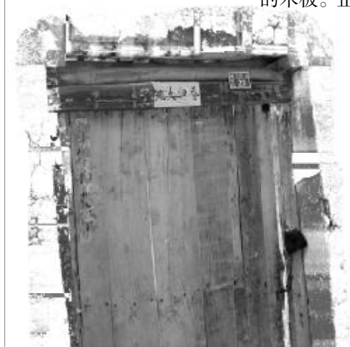
下沟村 23 号屋

刘芳艳携母离开老家快两年了，离家时，她委托堂哥刘岁存照看房子。当刘岁存打开尘封已久的大门让我们走进院落时，在春意盎然的季节，我们却感到了秋的凄凉。用干打垒围成的院子里，长满了杂草，四间房子，南北向一间，为正屋，东西向三间，为偏房，土坯墙上有许多大大小小的裂缝，室内墙上留下的漏雨的痕迹像画下的大幅地图，夯土地面潮湿得能挤出水来。三间偏房，一间是厨房，另一间堆满了可能是杜桂兰在家时割的柴草，中间是刘仓的房间，除了大炕，别无他物。正屋是杜桂兰的房间，大炕占据了房间的一半，左手边是三开门的立柜，油漆已渐渐脱落，立柜旁摞起两根直木锯成的木板。正对门是中堂，中堂挂的是悼念刘