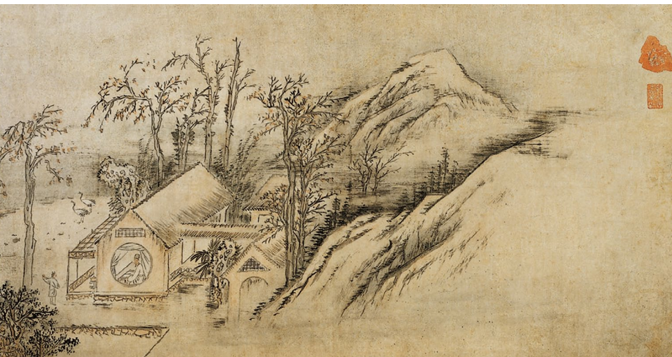
秋声赋图，纸本淡彩，56×214cm，湖岩美术馆

引用欧阳修的《秋声赋》，刻画萧索秋夜的孤独和寂寞。老年檀园的落寞哀伤跃然而出，化作贫瘠画幅上的荒凉景致。