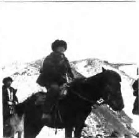
海拔5200米的唐古拉山