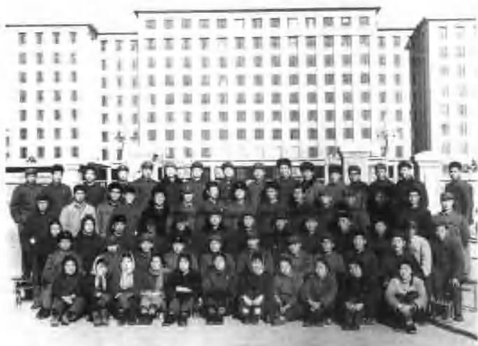
清华大学建工系参加建设青藏铁路的同学合影