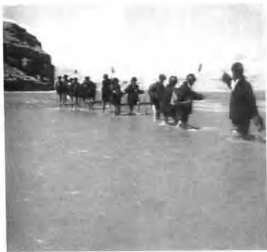
越过长江黄河的源头