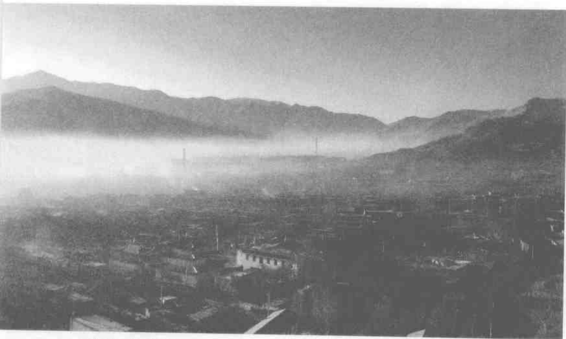
云雾笼罩下的年都乎村

小，不远千里从宁夏南行而去。直到有一天抬头仰望，看到一只大鹏鸟嘴中噙着一颗璀璨的吉星，他们知道，这是神的旨意。于是，夏琼山下，炊烟袅袅，就这样缭绕了一千多年。