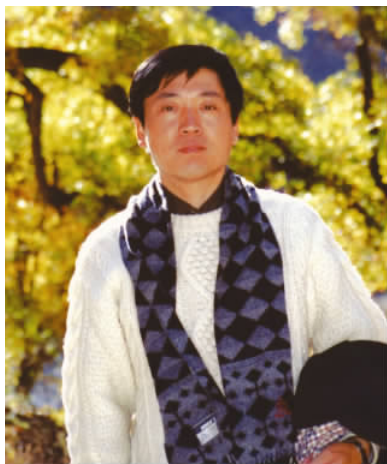
曹文轩 北京大学中文系教授 中国现当代文学博士生导师 著名作家