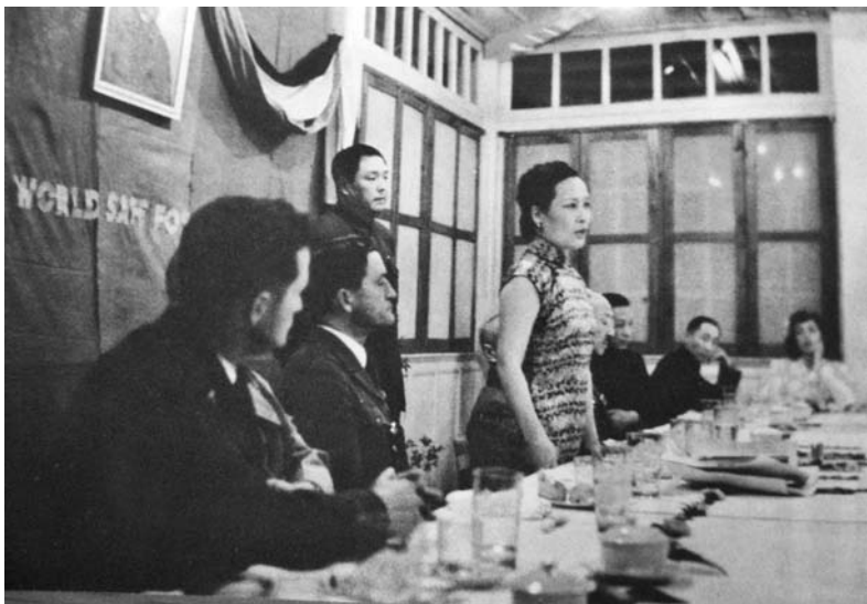
蒋介石、宋美龄宴请陈纳德的“飞虎队”队员

中国国运最严重的关头，你们带着希望和信仰飞越太平洋来到中国。因为这个缘故，不仅我国空军，而且我们全国都展开双臂来欢迎各位。你们光辉和英勇的事迹全世界都看到，飞虎队已成为举世最勇敢的一支空军。