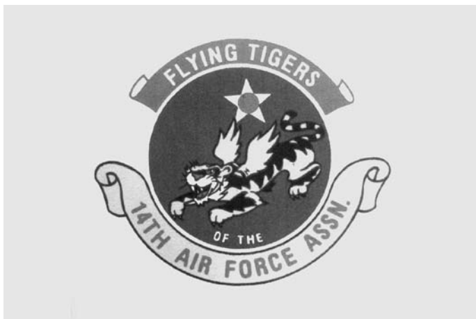
第 14 航空队标志