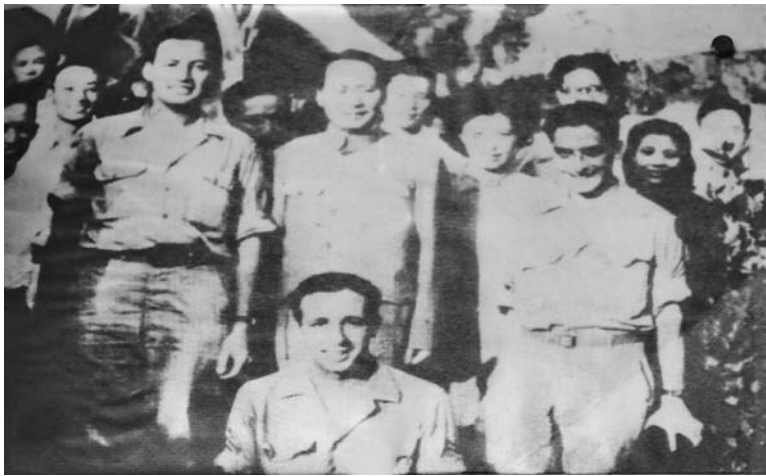
毛泽东接见飞虎队员

有资料显示，“飞虎队”在援华抗日期间共击落 2 600 架日机，击沉或重创 223 万吨日本商船、44 艘军舰、13 000 艘 100 吨以下的内河船只，击毙日军官兵 6 万多人。同时“飞虎队”也付出了巨大的牺牲。据战后美国官方的统计，仅在著名的援华空运航线——“驼峰航线”上，美国空军便损失飞机 468 架，牺牲或失踪飞行员和机组人员 1 579 人。