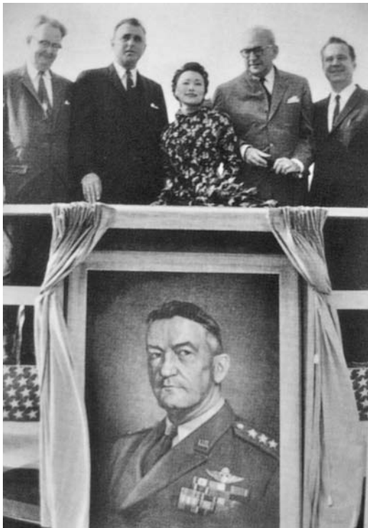
美国五角大楼内陈纳德画像

1945年陈纳德将军奉命回国时，重庆、昆明等城市的民众倾城欢送，万人空巷，表达了中国人民对他的敬意。