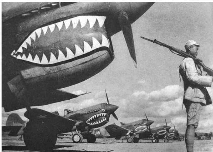
昆明机场的飞虎队战机