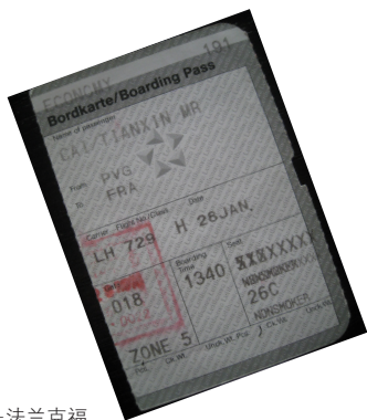
登机牌：上海—法兰克福。

当然，我无意在此否定这位物理学家出身的校长，事实上，从杨先生后来的言行来判断，他比起其他在任的中国同行来更具教育家的风范。我甚至想起了吉米·卡特，这位美国前总统也是在退休以后赢得了更为广泛的声誉。过去的二十多年间，欧洲对中国留学生的吸引力一直不如美国，这回终于瞄准空子，打了一个翻身仗。