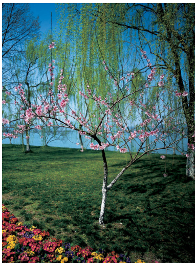
西子湖畔的一棵桃树。作者每年从这里出发去看世界。

考虑到上述因素，文中出现的人物名字就没有必要全是真名。事实上，许多有趣的人我连姓名都没有问及。但我有一个习惯，我所写到的每一件事必是亲身经历的，只是为了阅读上的方便，才作了个别时间意义上的调整。因此，万一出现了某种偏差，那也是由于我的记忆错误，而不是故意所为。