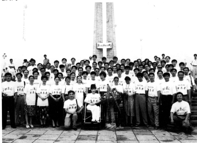
唐山大地震二十周年纪念日，作者（左一蹲者）同原空六军地震中幸存者留影，1996年7月28日。