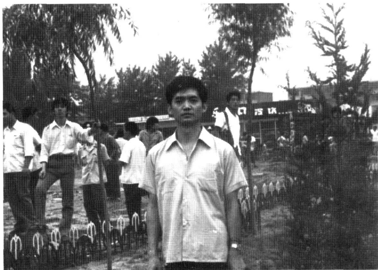
唐山大地震十周年纪念日，作者在当年脱险处留影，1986年7月28日。