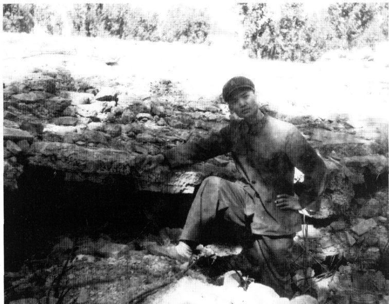
作者于唐山大地震脱险处留影，1976年9月。