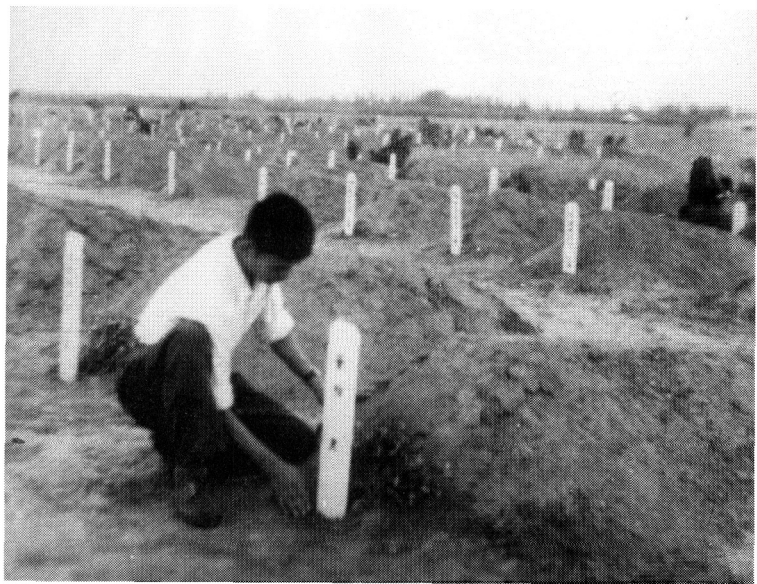
作者在震亡战友墓前