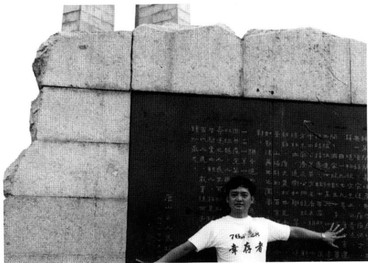
唐山大地震二十周年纪念日，作者在抗震纪念碑前留影，1996年7月28日。