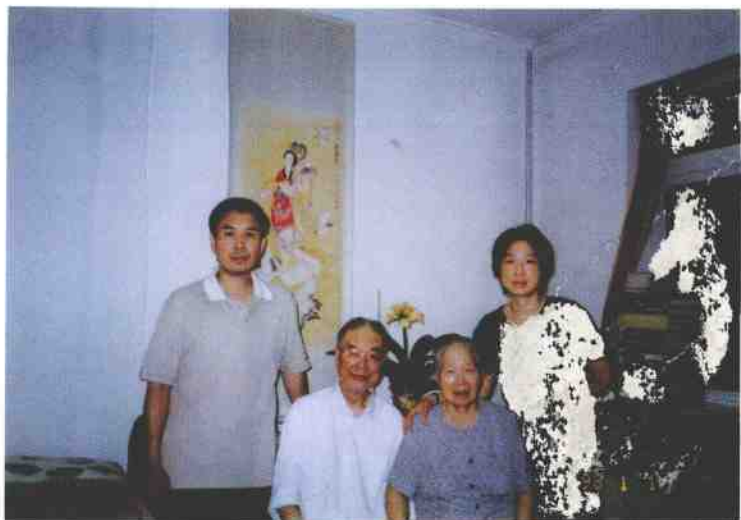
作者（左二）、夫人（右二）、及子（左一）、 女（右一）