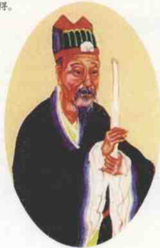
↑ 明朝开国功臣刘伯温

刘伯温（1311—1375），名基，字伯温，浙江青田人，明朝开国军师。明初任御史中丞兼太史令，封诚意伯。刘伯温自幼聪颖异常，天赋极高。在家庭的熏陶下，他从小就好学深思，喜欢读书，熟读儒家经典、诸子百家之书。尤其对天文、地理、兵法、术数之奥更是潜心研究，颇有心得。