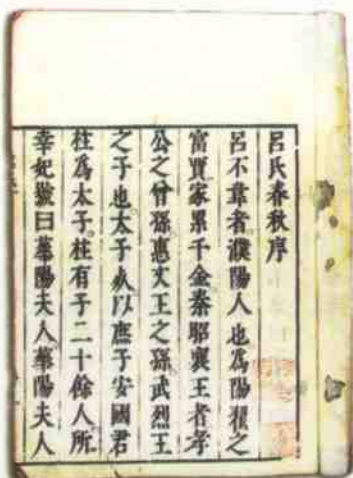
↑ 吕不韦组织门客编纂的《吕氏春秋》

↓ 吕不韦的墓冢在偃师一高校内。在历史上，吕不韦是应该大书特书的一个人，以前瞻的眼光看，正是他奠定了秦始皇统一六国的物质基础。