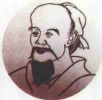
↑ 淳于髡以隐语的方式成功地劝说了齐威王。