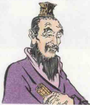
↑ 商人出身的丞相吕不韦

吕不韦生活在战国末期，却有着要求思想统一的倾向。所以吕不韦要门下客人，个个著其所闻，综合百家九流之说，畅论天地万物古今之事，最后汇编成书，名曰《吕氏春秋》。