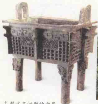
↑ 楚庄王时期的方鼎