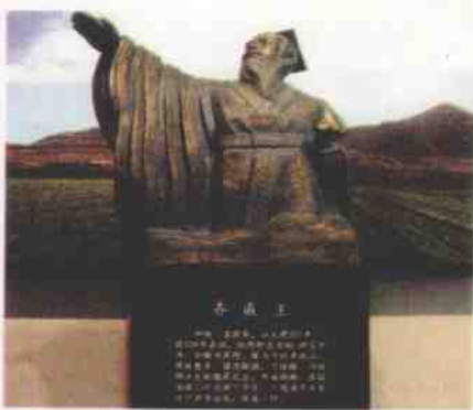
↑ 齐国历史博物馆中的齐威王塑像