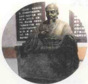
↑ 齐国历史博物馆中的孙臧像

齐威王能够做到不拘一格地任用贤才。他一面选用宗室中有智能的人为官，如田忌做将军，田盼子守高唐。一面又选用大批门第寒微的士人，委以重任。比如，因受妒而遭到迫害的著名军事家孙臧。孙臧从魏国逃归时本是刑余之人，是被追杀的囚犯，而到齐国后，以其丰富的军事理论和卓越的指挥才能，在田忌的推荐下，受到齐威王的信任和重用。