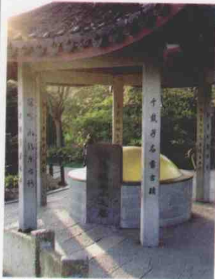
↑ 苏小小香冢上加盖有“慕才亭”，历代文人在此留下了无数诗篇。

“千载芳名留古迹，六朝韵事著西泠。”苏小小的才气、骨气和侠气倾倒古今，西泠桥边从此留下了无数激情的诗篇。唐代大诗人白居易作了一首《杨柳枝》，赞叹苏小小的爱才、惜才：“苏州杨柳任君夸，更有钱塘胜馆娃。若解多情寻小小，绿杨深处是苏家。”