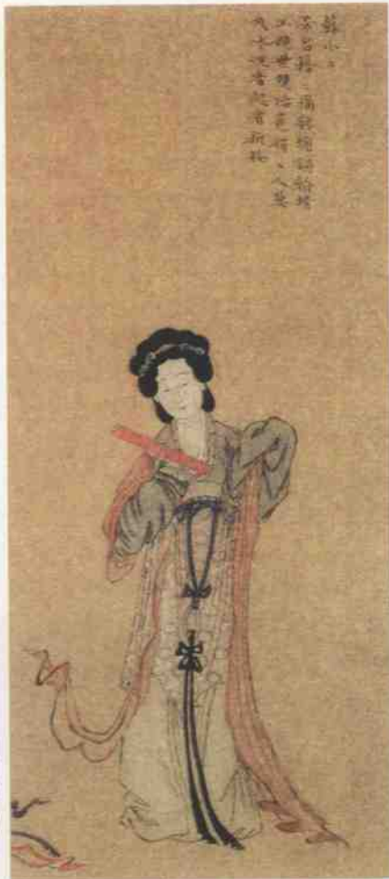
↑ 品貌出众的苏小小