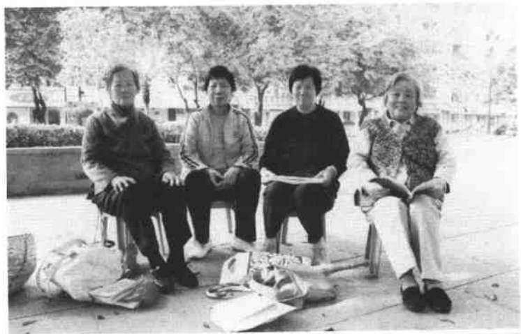
东莞城区市民,每天早上坚持传唱木鱼书。