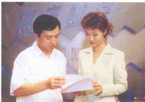
主持人与专家讨论案情