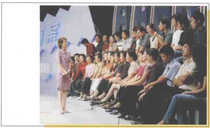
现场观众参与讨论