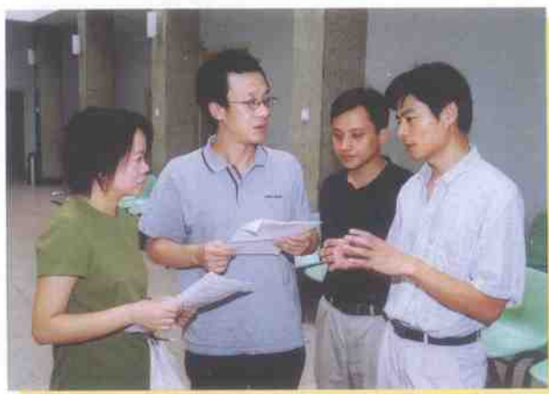
栏目组与法学专家交流节目