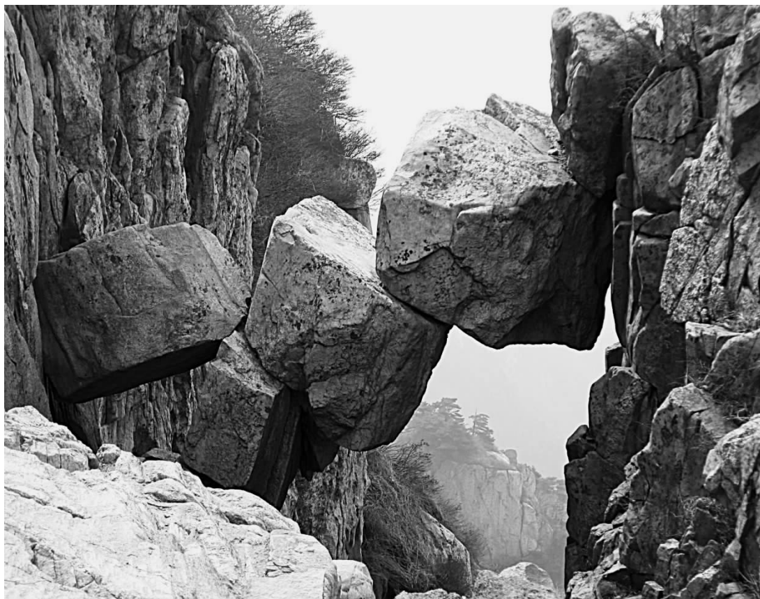
图 5 泰山仙人桥

构成泰山主体的泰山群变质岩，是世界上最古老的岩石之一。除了古老以外，泰山在地质学上还有两大特色：一是中国目前唯一发现有超基性喷出岩（科马提岩）的地区；二是泰山不仅拥有巨量的古老花岗岩，而且保存了良好和原始的多期次侵入关系，这实属举世罕见。它的重要科学意义在于给研究地球早期历史提供了重要信息与物质基础。