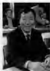
《赢在中国》第二赛季评委 汇源集团董事长