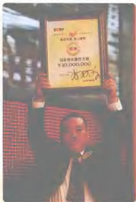
2007年中秋夜《赢在中国》第二季季大决赛，我最终取得冠军。