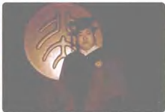
在北京大学光华管理学院硕士学位授予典礼上。这是我的第二个硕士学位。