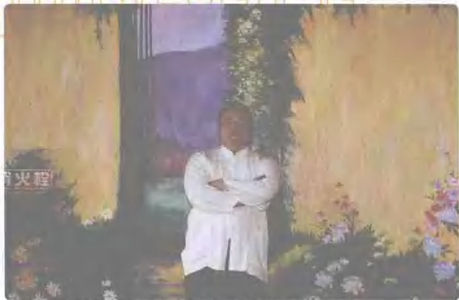
这是泊尚会所一面墙上的装饰，我喜欢这个地中海的装饰风格。