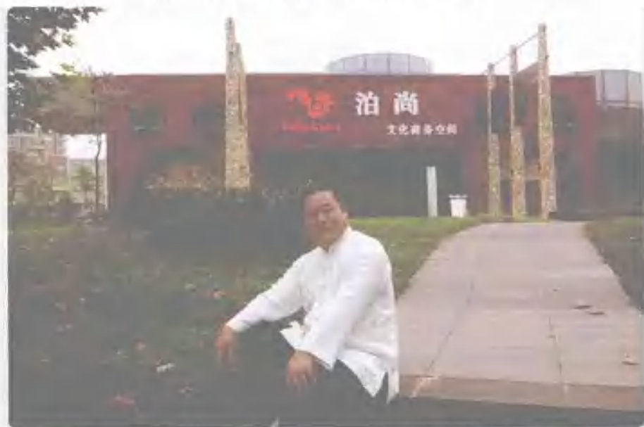
这是我们泊尚的大门，泊尚位于成都市的东湖公园里，东湖公园是一个纯天然生态公园，占地约五百亩。