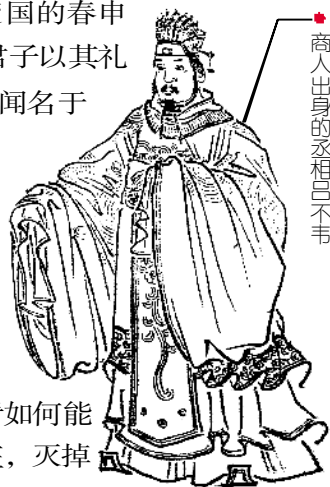
商人出身的丞相吕不韦

书成后，吕不韦将《吕氏春秋》公布于咸阳的城门旁，并将千金悬挂于书的上面，广邀各诸侯国的游士宾客前来评阅。吕不韦许诺：如果有人能在书中恰当地增加一个字或减去一个字，就奖赏给他千金。“一字千金”便是由此而来。