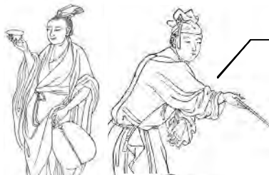
初唐四杰（左上：王勃，右上：杨炯，左下：卢照邻，右下：骆宾王）

王勃、杨炯、卢照邻和骆宾王被称为“初唐四杰”，其中又以王勃最为出名。王勃自幼聪明好学，诗文出众，七八岁时文章就已经写得很好，被人们赞为“神童”。他 14 岁被推举出仕，17 岁时被授官朝散郎。