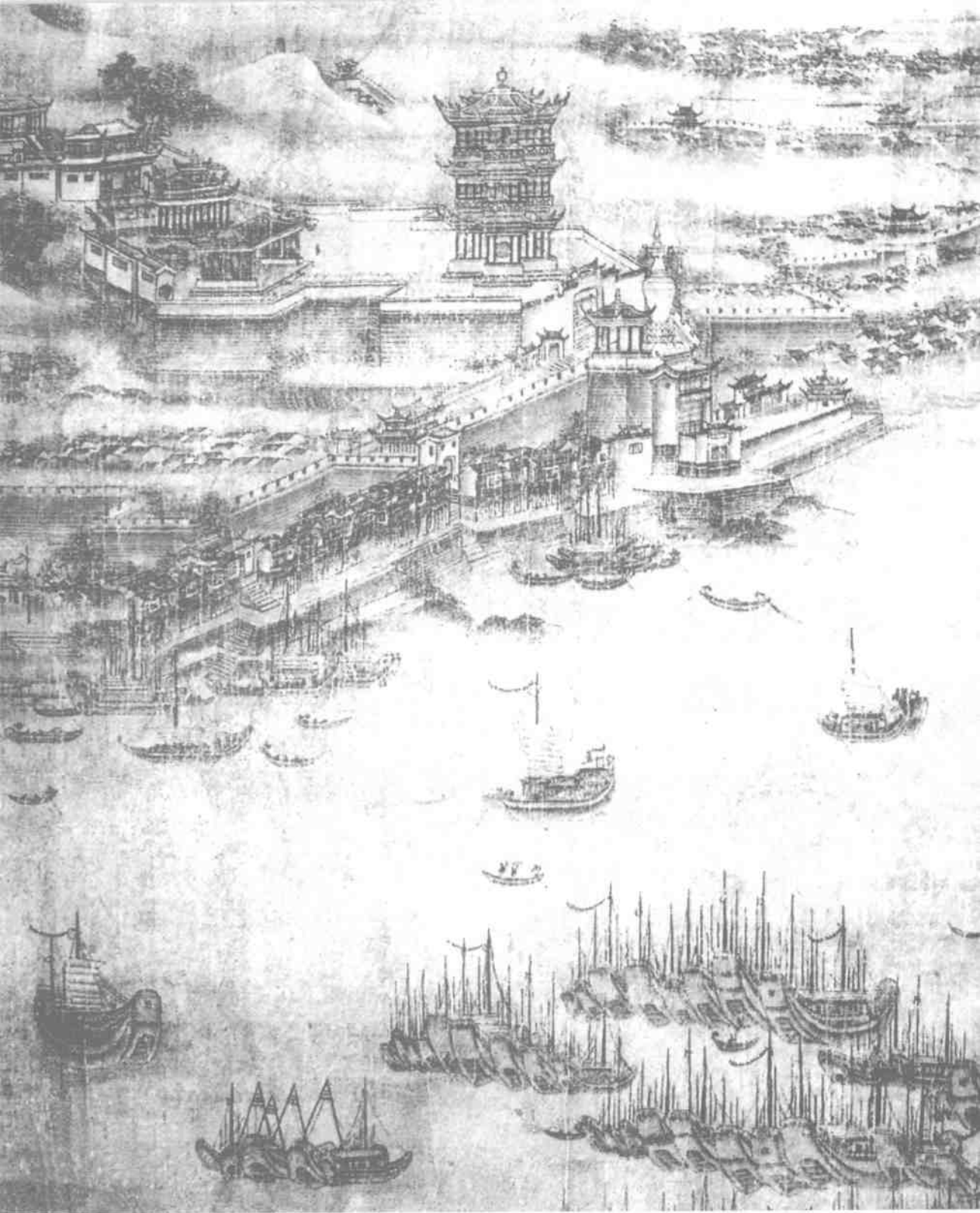
封面注文:129年前《湖北武汉全图》，那时的武汉三镇鼎立，山高水蓝，古韵悠悠，一幅天人合一的山水画卷。有人誉称此画为“武汉清明上河图”。它由清朝光绪2年（1876年）的海云画馆绘制，原件现藏北京图书馆。