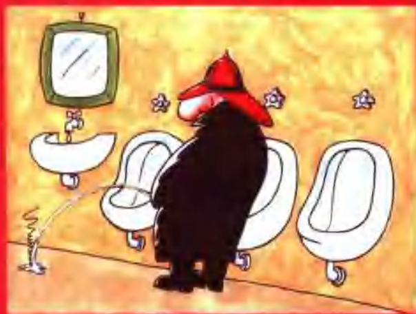
熊先生在公共厕所