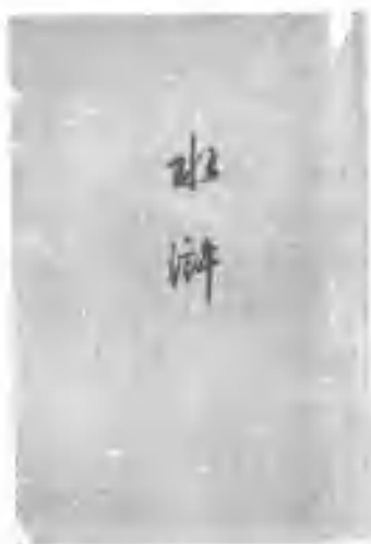
人民文学出版社1956年版《水浒传》，作者署名仅“施耐庵”。

“的本”是什么意思呢？“的”，就是确实确实是真的，不是假的，是原来的，不是后来的，不是冒充的。“的本”就是这个意思，也就是说，从这个题名来看，《水浒传》它确实确实是施耐庵写的；“编次”的意思就是编辑，整理。从这个题名来看，《水浒传》应该主要是施耐庵写的，罗贯中帮他整理，编辑而成的。所以说，如果是有两个作者的话，主要的是施耐庵，次要的是罗贯中。我是相信这个说法的。