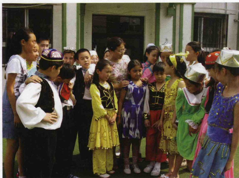
回民小学盛开民族之花，近10个民族的儿童在这里学习