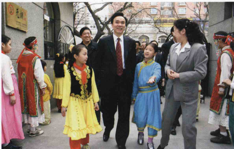
时任中共北京市市委副书记龙新民亲自到崇文区回民小学调研学写藏头诗校本课程的开展情况。