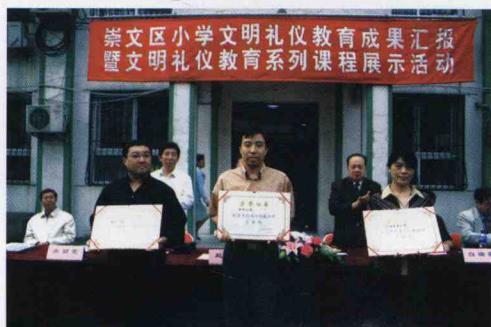
崇文区教委向实验课学校崇文区回民小学、金台小学、天坛东里小学颁发证书